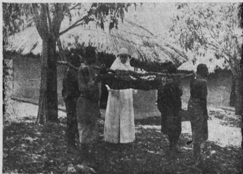
Zamorci nesejo težko bolnega v misijon.

Koncem preteklega mesca sem se zadržal en teden v misijonu Potive. Ljudstvo tod je zelo prijazno in mala četa kristjanov prav zgledna. Takoj ko sem prišel v ta kraj in bil še truden od dolge hoje po vročih in pekočih