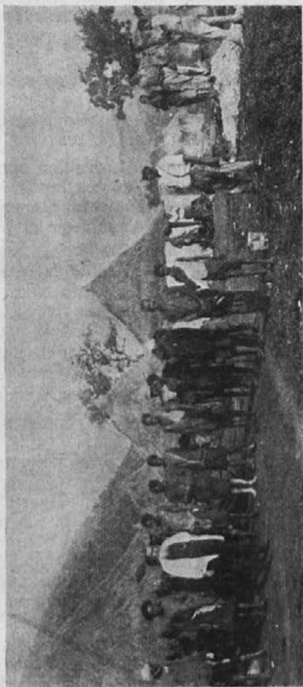
Misijonar s svojimi črnci prosi podpore za otvoritev krščanskih šol.

takega duha bo bodoča generacija. Žal so misijonarji revni, vsled česar ne morejo ustanoviti toliko šol, kot bi bilo potrebno, niti jih morejo vzdrževati. Naj slede odlomki iz pisem, ki osvetljujejo to vprašanje.