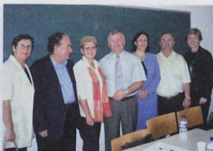
Kolegi iz Albanije so se zelo zanimali za naše izkušnje.