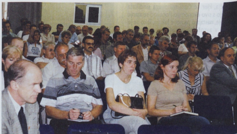
Na Žužkovih dnevih se je zbralo okoli 150 udeležencev.