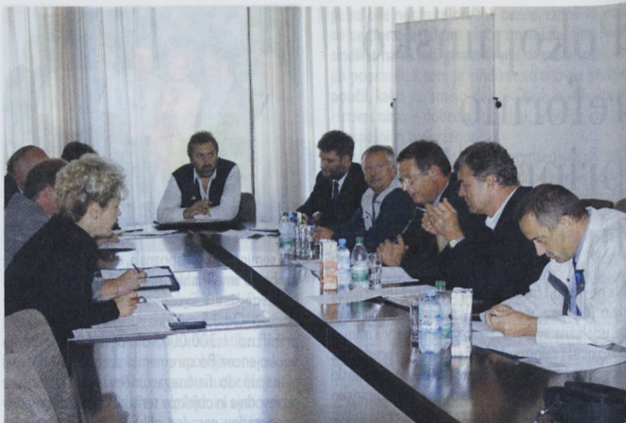
Udeleženci so se strinjali, da so takšna srečanja koristna.