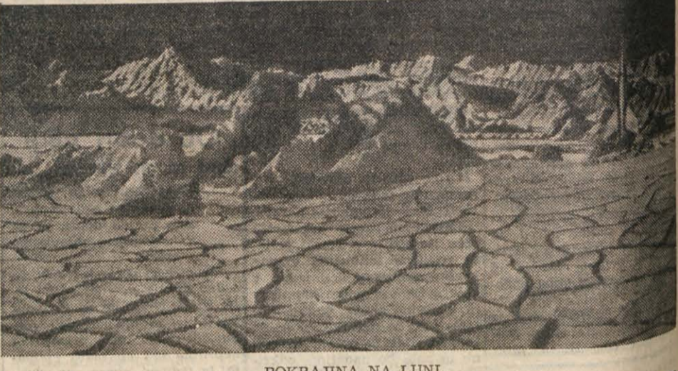
POKRAJINA NA LUNI.

(Eagle-Lion) v Hollywoodu, da je izdelalo lep barvani film «Na Luno», ki temelji predvsem na znanstveni podlagi, kakor zagotavljajo angleški in ameriški poročevalci. Za ustvarjanje filma so bili uporabljeni največje podatki iz astronomskih, astronautičnih in raketne tehnike. V filmu je potovanje na Luno opravljeno v enem delu in tako, kakor predvideva znanstvenik Gatland. Posadka štiri moža. Vozilo razvije po stopmoma bliskovito hitrost 40 km na sekundo (okoli 400 km na uro), ko zapusti Zemljo in leti 46 ur do Lune. V filmu pristane raketa kraterju Hargalut. Podatki, ki jih je pripravil Chesly Borelli, ki mu pravijo «prvi tujec» medplanetarne dobe, postane na Luni nekaj dni in potem vrne na Zemljo, kam se spusti s padali, ko se je bližja. Na Zemlji ves čas potuje po radiju, kaj vse doživlja po letu.