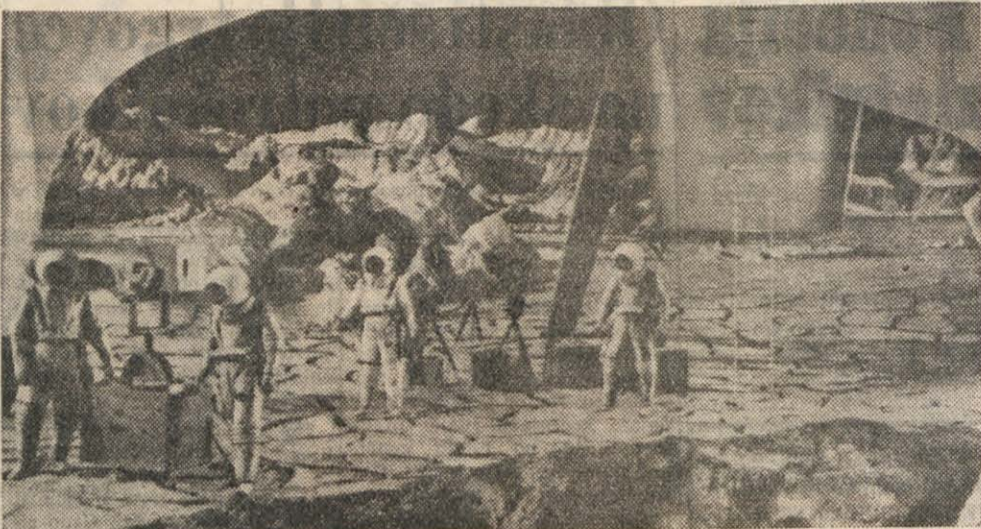
PRVI MOŽJE SO PRISLI NA LUNO. (IZ FILMA O POLETU NA LUNO).