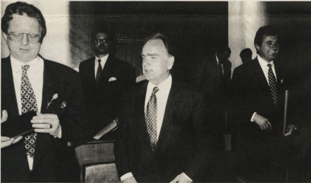
Socialdemokratski poslanci so zapustili dvorano in s tem je seja bila prekinjena