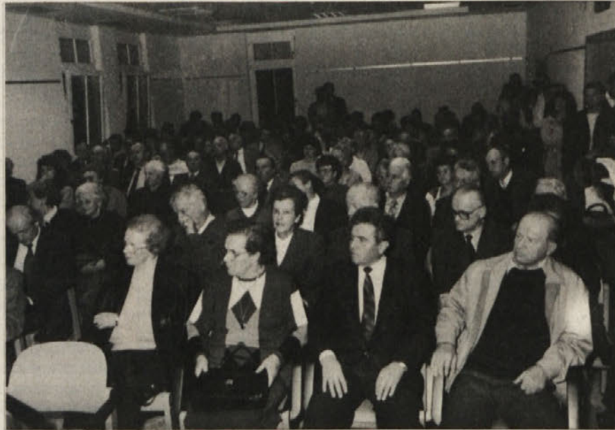
Pregnanci, njihovi otroci in vnuki v dvorani Občinskega centra so z zbrano resnostjo prisluhnili.