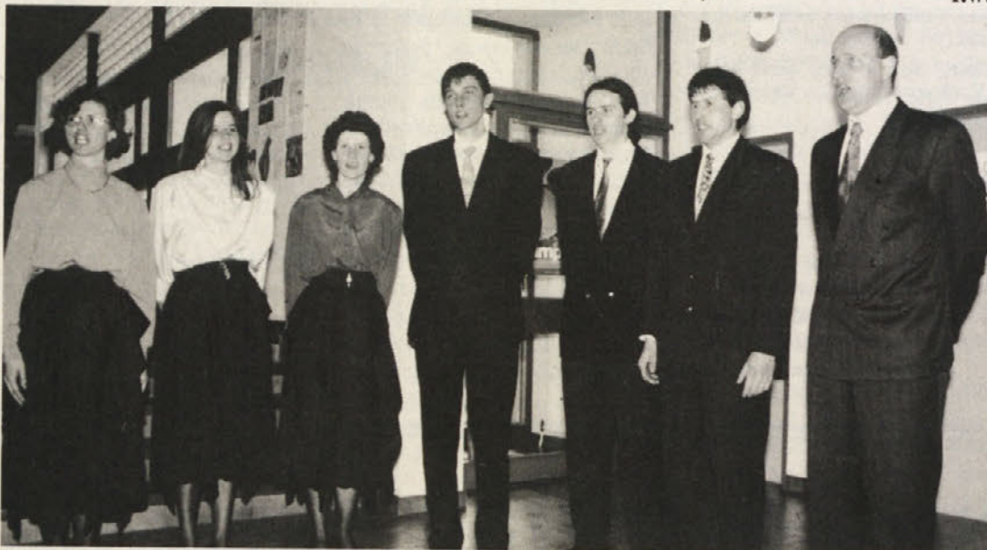
Zbor PD „Lipa“ iz Velikovca