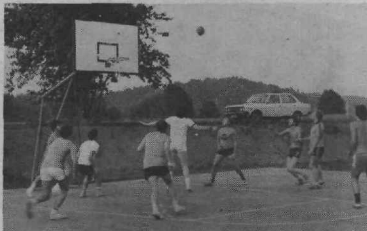
Košarkarske mreže so že obmirovale, nogometaši pa bodo v trimski ligi v tem tednu odigrali še zadnja srečanja. Boji so ogorčeni, sreča nasmehnjena zdaj temu, zdaj onemu, ob koncu tekem pa so vsi zadovoljni, saj ne gre za prvenstvo, ampak predvsem za rekreacijo.