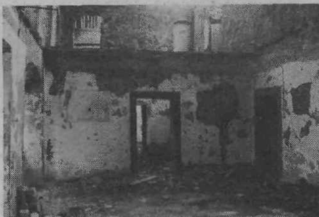
Vojna vihra objektu ni prizanesla, zob časa pa nadaljuje uničevalno delo.