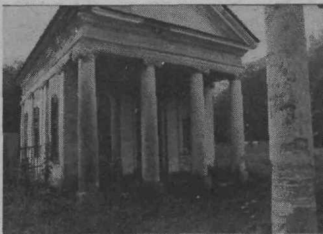
Paviljona bodo sicer rešili, čeprav sta oba v precej žalostnem stanju, graščina pa še naprej propada...