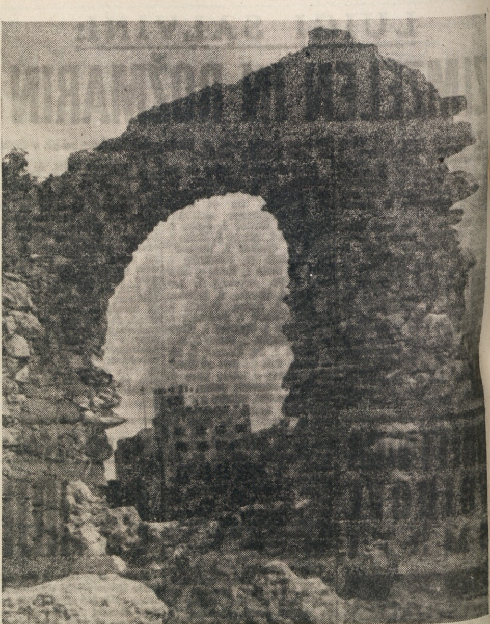
RUSEVINE STAREGA IN NOVI DEVINSKI GAD