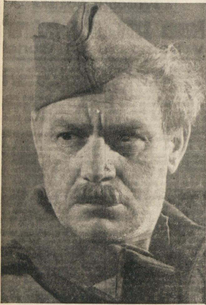
Potokar v filmu aNa svoji zemlji

Nastopil bo v vlogi glavarja v Gogoljevem Revizorju, ki bo 4. marca letos v Avditoriju