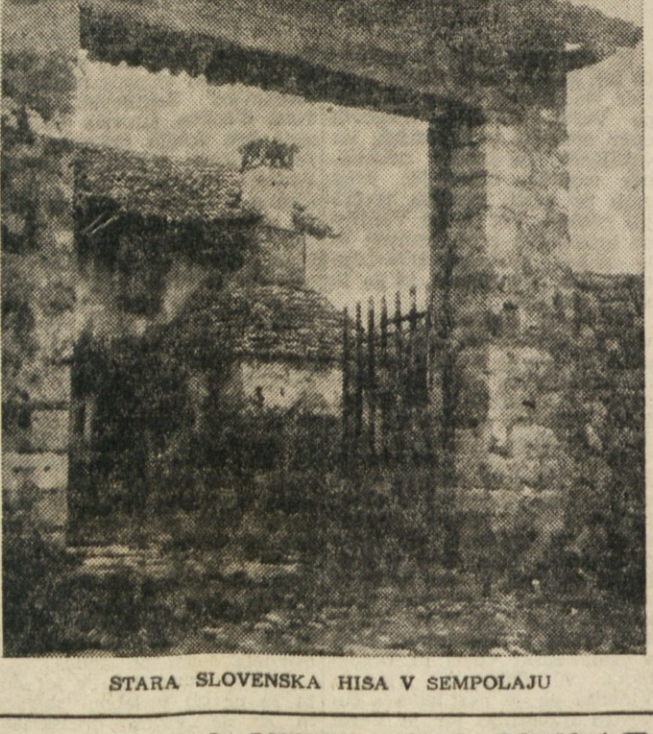
STARA SLOVENSKA HISA V SEMPOLAJU

Naše žole segajo v dobo, ko je nastal avstrijski solski zakon (pred 80 leti). Iz prvotnih zaslonih sol po župniščih, kjer so poučevali duhovniki, so