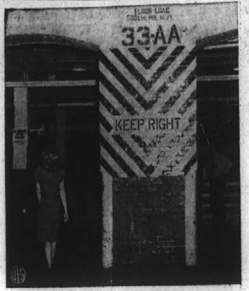
Ne vpoštevalo napisov. — Varnostni oddelek pri B. F. Goodrich Co. v Akron, Ohio je opazoval v koliko delavci oziroma uslužbenci te tovarne vpoštevalo varnostni napis pred tovarno. Pokazalo se je, da 42 odstotkov ženskih sploh ni vpoštevalo napisov "Keep right," pa tudi moški niso popolni, kajti 18 odstotkov teh se ni oziralo na napis.