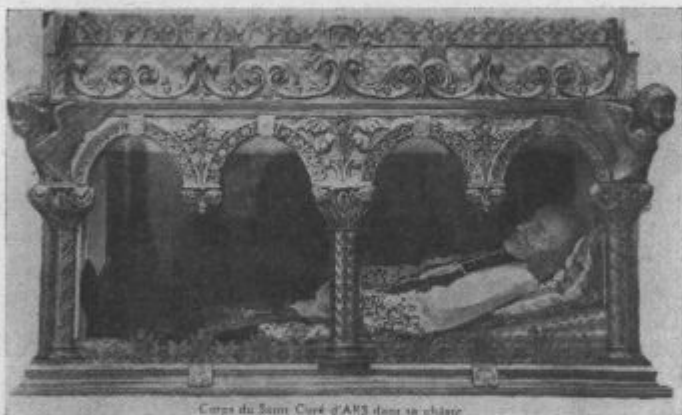
Grob sv. Ivana Vianneya v Arsii z njegovim svetim telom.

Popunoma je bio miren. On, ki je do zadnje kaple spio kelih bolečin, trpljenja i zemelskoga pregnanstva, je vživao zdaj sladkost smrti, od štere je sam pravo: — Kak lepo je vmreti, či si na križi živo.