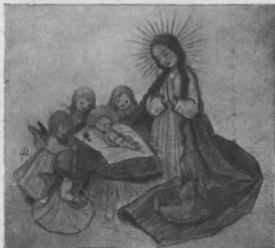
Z ANGELČKI MOLIMO JEZUŠEKA.

Te prime Marija šče izda klečeč božansko Dete od arkangela. Z nežnimi rečmi spregovori, kda ga je gledala na svojih rokah: „Lübvav moja najslajša, svetlost mojih oči, življenje moje düše! Dobrodošeo na tom sveti, ti sunce pravičnosti, da preženeš kmico greha i smrti. Pravi Bog od pravoga Boga, reši svoje sluge. Vse stvari naj gledajo tistoga, ki nam nosi odrešenje. Sprimi svojo robinjo, da ti slüži i nadomesti njeno nesposobnost. Mili moj Sin, včini me takšo, kakšo ščeš, da bom!“ Nato se premodra Devica obrne na večnoga Očo, da njemi daruje svojega sina: „Najvišji Stvoriteo vsega sveta, glej žrtvenik i tebi prijetno žrtev! O moj Gospod, gledaj od te võre z očmi smile-