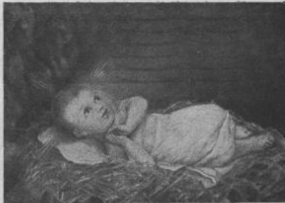
Jezušek, molimo Te...

Marija pozove ždaj svojega zaročnika, šteri je gledao v prikazni vse, ka se zgodilo, a zdaj je mogeo prvi od Adamove dece gledati pri būdnih čūtaj vtelovleno Reč i jo častiti. Vido je, kak je presveta Mati držala Detece v naroči i ga pritiskala na svoja vūsta i srce. Ves radosten i oblejani s skuzami je častio Boga i njemi polūbo nogice. Kda je sv. Jožef opravo počastitev, prosi Marija, štera je dozday klečala, svojega božanskoga Sina, da njoj dovoli sestiti. Te ga ona zasūče v plenice, štere njoj je dao Jožef. Položi ga v jasli na eden kamen na slamo i seno. To je bila njemi prva posteo. Iz bližnjega pola pride eden vol v votlino i se pridruži osli, ki je ta prineseo presveto Devico. Ona zapove živalima, da skažeta čast svojemi Stvoriteli, kak najbolje znata. Obe spadneta na kolena pred detetom i sta ga segrevali z dihanjom i njemi skazala vse časti, štere so njemi skratili lūdje. Tak se spuni prorokba Izaije (1, 3): „Vol pozna svojega lastnika, a oseo jasli svojega gospodara.“