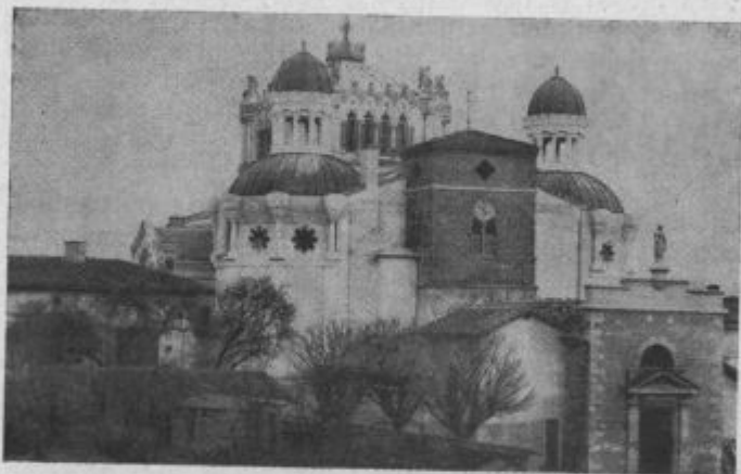
Cerkev v Arsi, v šteroj počiva telo sv. Ivana Vianneya.

Z velkov mokov je šantao dečak ob maternoj roki do oltara sv. Filomene. Tam je dugo časa klečeč molo i gledao podobo sv. Filomene, poleg njega pa je v skuzaj klečala mati. Nazadnje pa se zdigne dečak i pravi: — Lačen sam. Mati ga šče vzeti na roke, a on beži mimo nje proti dveram, na vulico, gde se je pomešao med veselo deco.