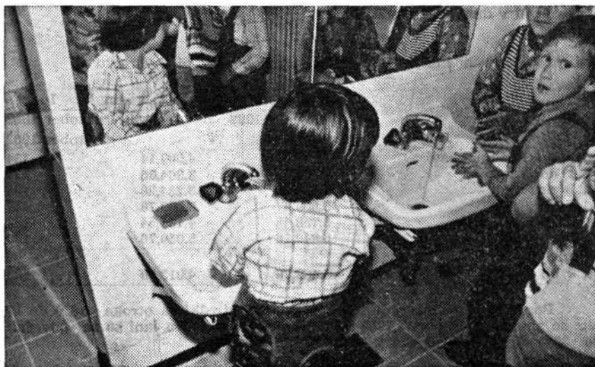
Tabela 5: Mesečni skupni življenjski stroški za otroka v oktobru 1982 glede na vrsto varstva

Mesečni materialni življenjski stroški za predšolskega otroka, ki je v varstvu v VVO, so znašali v oktobru 1982 3.999,81 din, za otroka, ki je v zasebnem družinskem varstvu, pa 4.065,70 din. Tako v prvem kot v slednjem primeru so za 35% višji kot v oktobru lani.