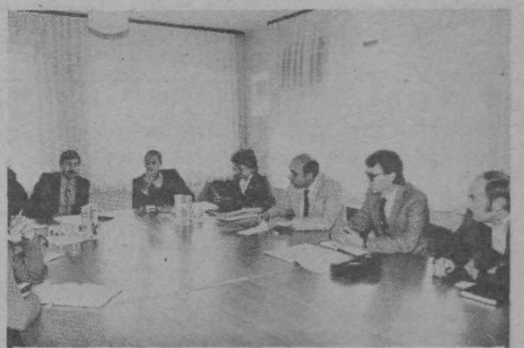
Prejšnji teden je bila na delovnem obisku pri OK ZKS Ljubljana Moste-Polje delegacija OK ZK Srbije iz Gornjega Milanovca. V pogovoru na komiteju, v Rogovem tozdu Dvokolesa in v Kolinski se je seznanila s političnimi razmerami in naporu, s katerimi v naši občini uresničujemo stabilizacijski program.

Medtem tudi že gradijo krajevno kablensko omrežje, ki bo pokrilo celotno območje ATC Polje. Gradnja je razdeljena na več faz in bodo z njo nadaljevali še v prihodnjem letu, tako da bodo v prvi polovici leta 1984 telefone dobili vsi prosienci, ki živijo na območju ATC Polje. Tako bodo predvidoma pokrite vse potrebe po telefonskih priključkih na tem območju. S. L.