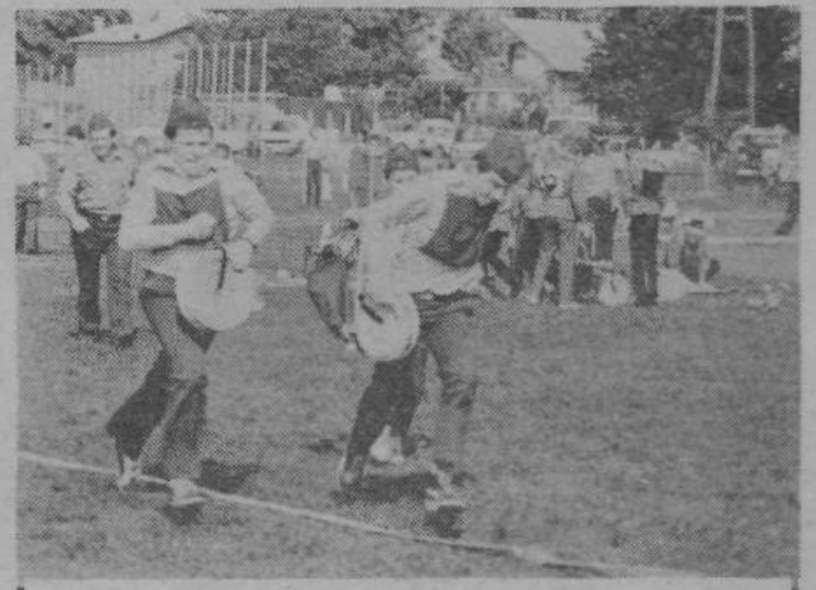
Sredi prejšnjega meseca je bilo v športnem parku na Vevčah republiško tekmovanje selekcij mladih gasilcev SR Slovenije. Udeležilo se ga je več kot 2000 mladih tekmovalcev.