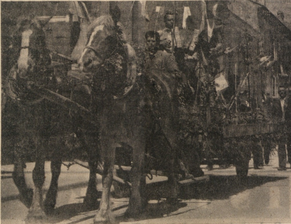
ZADRUGARJI IZ ANKARANA NA MANIFESTACIJI 1. MAJA V KOPRU.

FOLKLORNA SKUPINA IZ DEKANOV NASTOPA Z NARODNIMI PLESI NA PROSLA. VI 1. MAJA