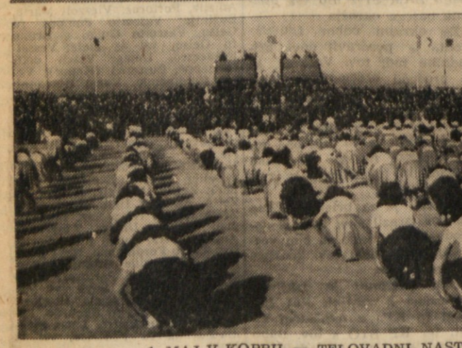
1. MAJ V KOPRU — TELOVADNI NASTOP NA STADIONU