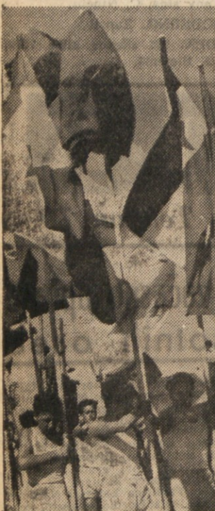
ZASTAVE BRATSTVA PLAPOLAJO V VETRU.