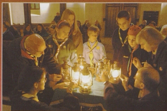
Mir in veselje v novem letu (na sliki Betlehemska luč 2003)