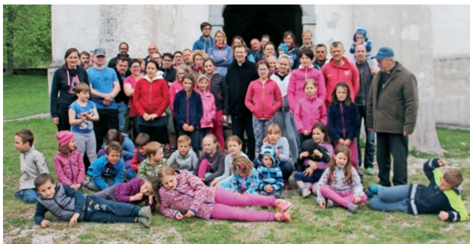
Okrog 60 otrok in staršev družinskega verouka je v začetku maja poromalo na Planinsko Goro.

Sproščeni pogovori in igrivost otrok so prispevali, da je pot do romarske Marijine cerkve hitro minila. Pred cerkvijo nas je že čakala 'tehnična ekipa', ki je poskrbela, da smo za prvo silo privezali dušo. Sledil je kviz o poznavanju Svetega pisma, kjer so sodelovale vse družine. Najprej so morali