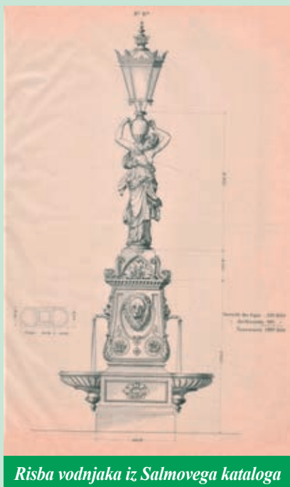
Risba vodnjaka iz Salmovega kataloga

starodavnih časov simbolizirali varuhe pomembnih lokacij) in na njem stoječ post-canovovski kip nimfe z vrčem – prodajala z na vrhu vaze postavljeno lanterno. Dodatek svetilke (ene ali več) je bil tudi sicer pri litoželeznih vodnjakih zelo pogost, saj, kot pravijo, kaj koristi (iz)vir vode, če ga ne vidimo. Dvojniki logaškega vodnjaka stoji v Šmarjeških Toplicah, kamor je bil po sili razmer prenesen iz Novega mesta. Zanj vemo, da je prvotno na vrhu imel svetilko, ker so se ohranile fotografije iz časa pred 2. svetovno vojno, ki ga kažejo v popolni formi (na tem mestu se zahvaljujem gospe Anici Bobič za poslano slikovno gradivo, ki je objavljeno tudi v njeni publikaciji o družini Gregorič iz Novega mesta, nekdanji lastnici zdravilišča v Šmarjeških Toplicah). Z veliko verjetnostjo zato lahko rečemo, da je tudi litoželezni vodnjak na Čevicah sprva kronala svetilka. In z malo domišljije si lahko pričaramo vzdušje na nekdanjem trgu Franca Jožefa, pomembnem vozlišču ob Tržaški cesti, obdanem z impozantnimi furmanskimi gostilnami, ko je bila javna razsvetljava še prava redkost, a je ta prostor domačinom in popotnikom nudil tako okrepčilo z vodo kot tudi svetlobo, ko se je stemnilo.