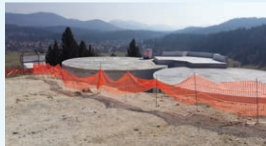
Med gradnjo vodohrana Sekirica

Z izvedenimi deli bodo ob zaključku celotnega projekta v vseh občinah izboljšali kakovost pitne vode in razdeljevanje razpoložljivih vodnih količin iz različnih virov oskrbe, s čimer bo možno nemoteno in varno oskrbovanje tudi v primerih možnega izpada posameznega vodnega vira ali dela sistema zaradi okvare. Na območju vseh petih občin gre za izboljšavo 3.568 metrov obstoječega vodovoda in novo-gradnjo 14.746 metrov vodovodnega sistema s pripadajočimi objekti: štirih vodohranov, dveh črpališč, dveh zajetij vode in ene vodarne. Na sistem oskrbe s pitno vodo se bo tako lahko priključilo dodatnih 228 priključkov.