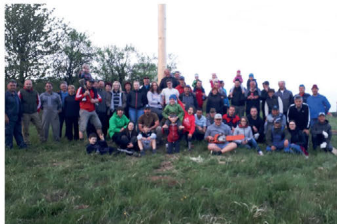
Postavitev majskega drevesa na Vogrinčevem bregu 26. 4. 2019

Žetalski gasilci se tudi letos nismo izneverili svoji tradiciji postavljanja majskega drevesa, ki simbolizira mednarodni praznik dela, 1. maj. V ta namen je bilo treba najprej določiti lokacijo majskega drevesa. S privolitvijo podpredsednika in blagajnika PGD Žetale,