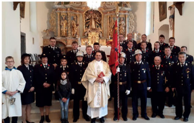
Članice in člani PGD Žetale v cerkvi Marije Tolažnice 5. 5. 2019