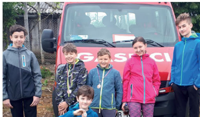
Pionirji in mladinci PGD Žetale na 4. tekmovanju GZ Videm v orientaciji v Apačah, 12. 5. 2019

Na 4. tekmovanju GZ Videm, ki je bilo 12.5.2019 v Apačah, so pionirji in mladinci PGD Žetale dosegli lep uspeh. Pionirji so dosegli 3. mesto in prejeli medalje, mladincem pa je za las ušlo mesto, ki vodi na stopničke, saj so zasedli 4. mesto