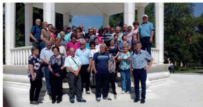
Pred največji kamenim paviljonom v Evropi v Bjelovarju, 5.6.2019

več nacionalnosti: Hrvati, Srbi, Čehi, romi in drugi. Ko je pomladno sonce že močno pripekalo, smo prispeli na glavni trg Bjelovarski Eugena Kvaternika, ki ga krasí največji kamniti paviljon v Evropi, zgrajen je iz belega bračkega kamna. Paviljon obkrožajo štirje veličastni kamniti kipi zgodovinskih osebnosti iz verskega področja: sv. Terezije Avilske, sv. Jurija, sv. Jelene Križarice in sv. Janeza Nepomuka. Na stopnišču paviljona smo naredili spominsko fotografijo in že nas je pot vodila v katedralo sv. Terezije Avilske, ki je osrednja cerkev deset let stare Bjelovarsko-Križevske škofije. V katedrali nam je redovnica ki skrbi za to veličastno cerkev, povedala marsikaj zanimivega o njeni zgodovini. Cerkev so pričeli