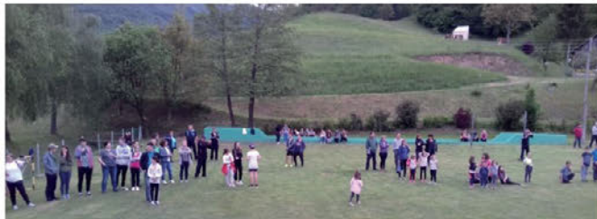
Otvoritev balinišča na igrišču pri OŠ Žetale, 11.5.2019

V soboto, 11. maja 2019 v popoldanskih urah je bilo na igrišču za Osnovno šolo Žetale nadvse slovesno, saj so bili v uporabo predani Športni objekti v okviru projekta: Medgeneracijski izzivi