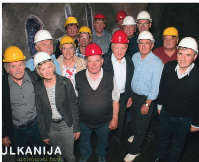
Veterani GZ Videm v doživljajskem parku Vulkanija 24.5.2019