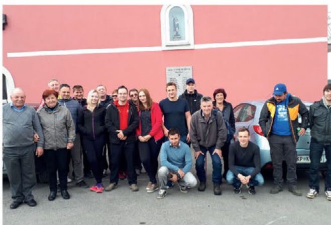
Članice in člani PGD Žetale na Šparglijadi v Krkavčah 7.4.2019

Po nekajletnem premoru so nas iz prijateljskega društva PGD Krkavče znova povabili na tradicionalno prireditev, nabiranje špargljev. To prireditev organizirajo vsako leto v aprilu in nanjo povabijo društva, s katerimi so spletili prijateljske vezi po celi Sloveniji. Letošnje prireditve, ki je potekala v nedeljo, 7. aprila 2019, so se poleg domačinov udeležila naslednja društva: PGD Radvanje, PGD Obrež in PGD Žetale. Šparglji so zdravilna rastlina, ki raste na Krasu in Primorskem ter se nabira v mesecu aprilu in maju ali celo v juniju.