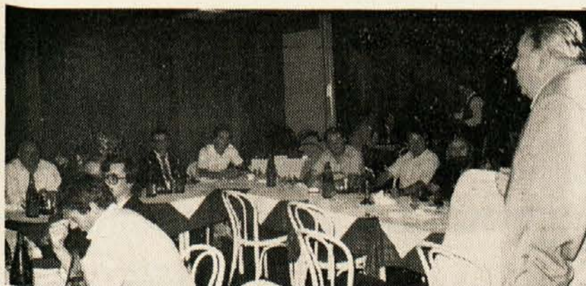
V zanimivih predavanjih in pogovorih ter v sproščeni družabnosti je potekalo pisateljsko srečanje na Obirskem. Udeležence srečanja je v hotelu Obir sprejel tudi kapelški župan Lubas.