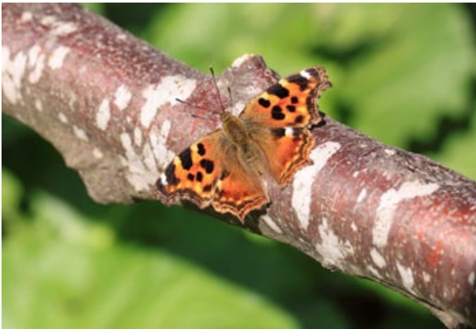
Vzhodni leptotec ( Nymphalis vaualbum ).

Risba sovkinih kril z imenovanjem delov kril, ki so pomembni za določanje vrst. Slovenski metuljar je opremljen s 15 ilustracijami izpod rok 13-letnega Danila Bučarja. Julij Bučar je bil prvi, ki je tuja strokovna imena prevedel v slovenščino.