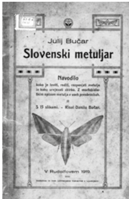
Naslovnica Slovenskega metuljarja.