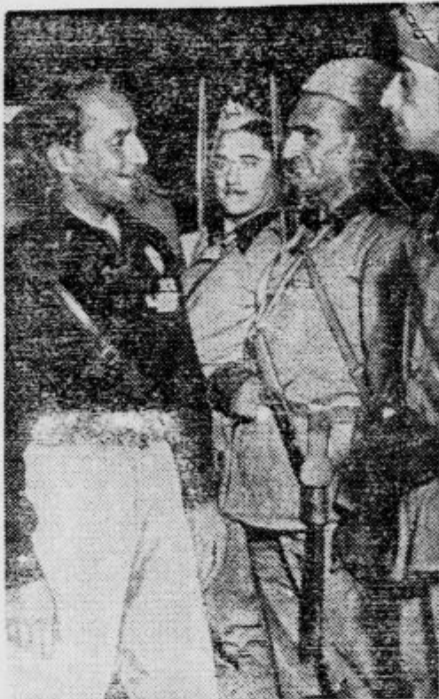
Generalni tajnik fašistične stranke Starace pregleduje miličnike in jemlje od njih slovo pred odhodom v Vzhodno Afriko