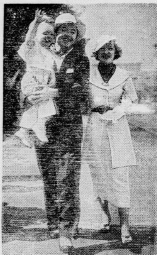
V Ameriki se je udomacila navada, da filmski zvezdniki, ki nimajo lastnih otrok, jemljejo tuje za svoje. Filmski zvezdnik Jack Haley si je na ta način tudi preskrbel sinca, ki ga vidimo na sliki v njegovem naročju