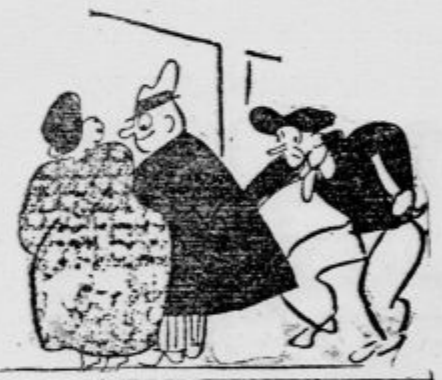
»Ne, Amelia! Denarnico imam v drugem žepu!«