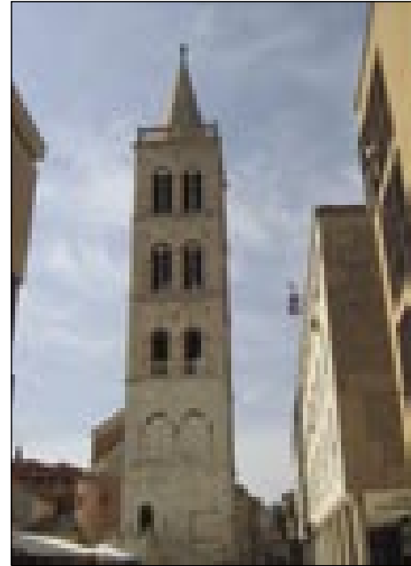
Staro pa moderno vküper v Zadri

Leta 1999 so na Pagi najšli med kamlami eden mali trikotnik