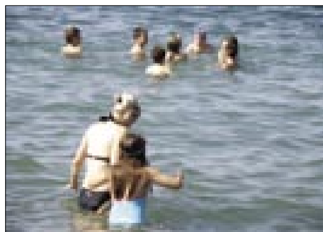
Prijetno kopanje v morju

Na jezikovnih počitnicah v Piranu nam je bilo zelo lepo. Bilo je veliko zabavnih in včasih tudi ne preveč prijetnih trenutkov. Vendar