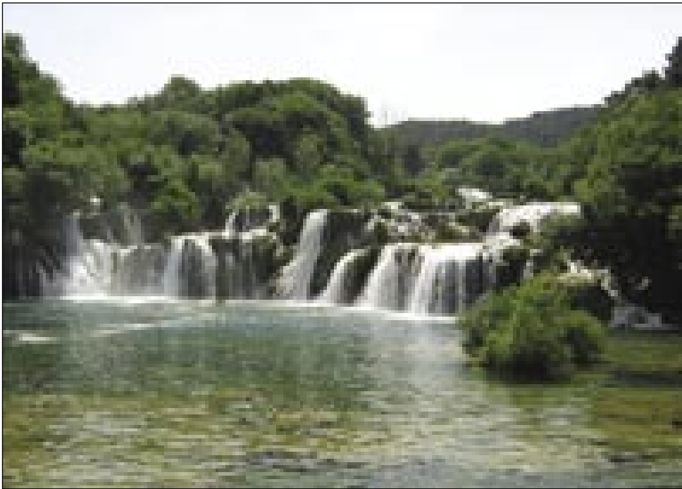
Najvekši slapovi v Narodnom parki Krka

varašov na Rovačkom, za šteroga ništerni pravijo, ka prej tam sunce najlepše dojdé na cejlom svejti.