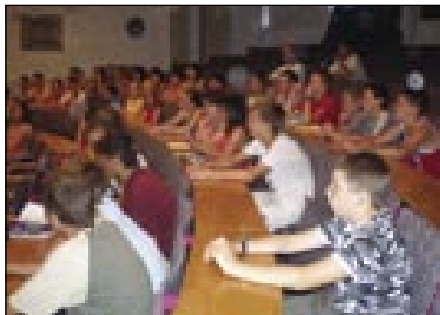
Med učenjem na piranski šoli

da si v osmih dneh ogledate Tonino hišo, se sončite, plavate, potepate po Piranu, greste v Lipico, si ogledate Škocjanske jame, obenem pa se še učite. Vse to smo počeli mi na jezikovnem taboru. Sama sem se najbolj zabavala