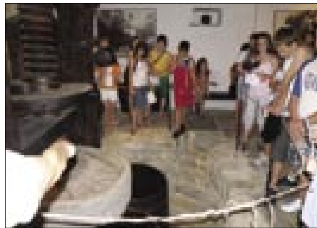
Na izletu v Tonini hiši

zatorjem, ki so nam omogočili to, da smo lahko preživeli čudovite dneve v Piranu in njegovi okolici. Udeleženci seminarja iz Porabja