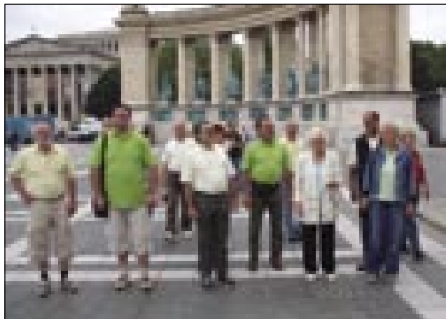
Med ogledom Budimpešte na Trgu herojev

Vsako naše novo srečanje je še bolj prisrčno in bolj domače, saj se poleg uradnega nastopa tudi sproščeno poveselimo ob slovenski glasbi in se tudi marsikaj