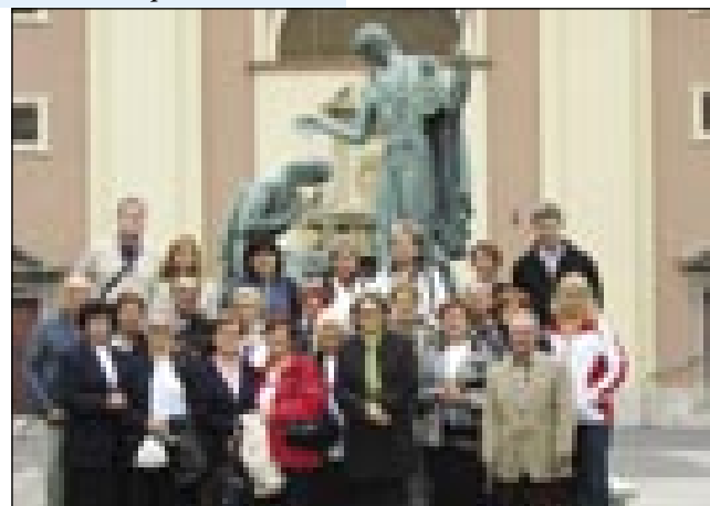
Sombotelski Slovenci s prauškari iz Sečovelj (2008)

Že deset lejt odijo sombotelski Slovenci na prauško v Slovenijo. Več kak dvajsti cerkve so