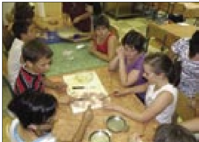
Na delavnici smo delali tudi namaze

36 Porabcev in 5 Prekmurcev se je skupaj odpravilo na jezikovni tabor v Piranu. Naloga nas Slovencev iz Slovenije je bila, da Porabske Slovence naučimo