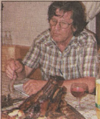
Vesel zna biti vesel.

sporazum. Kar zadeva Krošlja in njegovo firmo KIN pa v Sevnici upajo, da bo od njegovega grozdenja tudi kaj koristnega pridelka. Marsikaj koristnega bi bilo denimo mogoče izluščiti tudi iz izkušenj, ki jih imajo posavski seniorji. Na nedavnem druženju v Nerezinah bi ob udeležbi krškega in sevniškega župana - brežiški, ki je