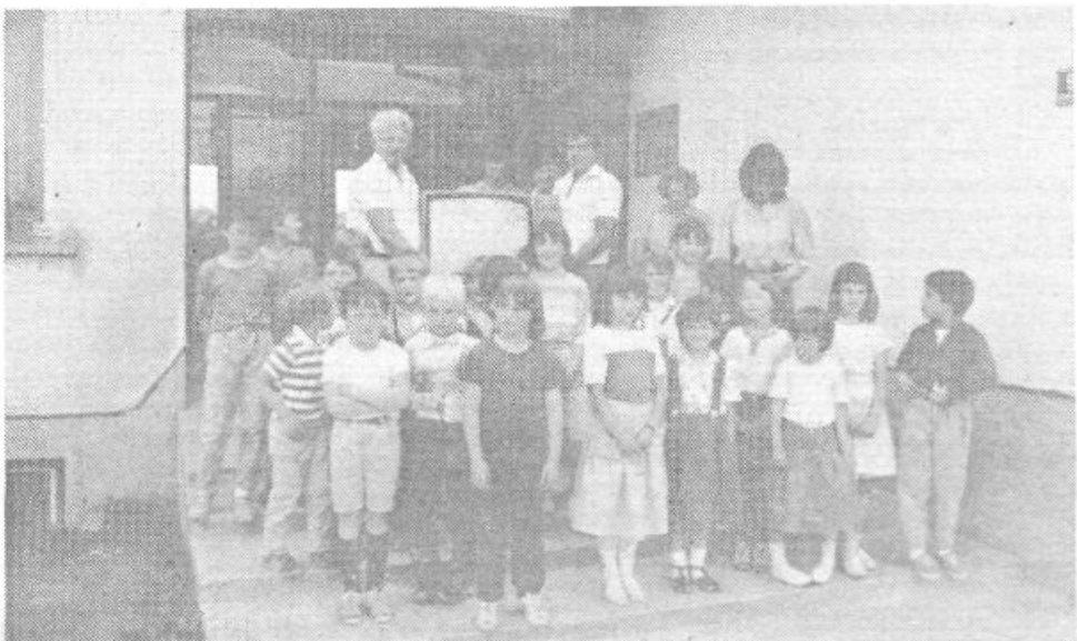
Učenci in delovni kolektiv OŠ Šentjošt skupaj s predstavniki DO Belinka ob sprejemu TV sprejemnika in viderekorderja.