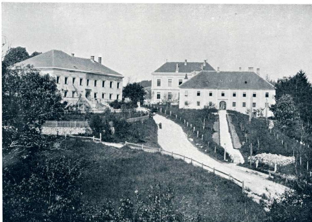
BOLNIŠNICA USMILJENIH BRATOV V KANDIJI

„Čemu usmiljenje, koga bi se usmilil?“ je izpregovoril Damjan tiho. „Božja stvar je usmiljenje,