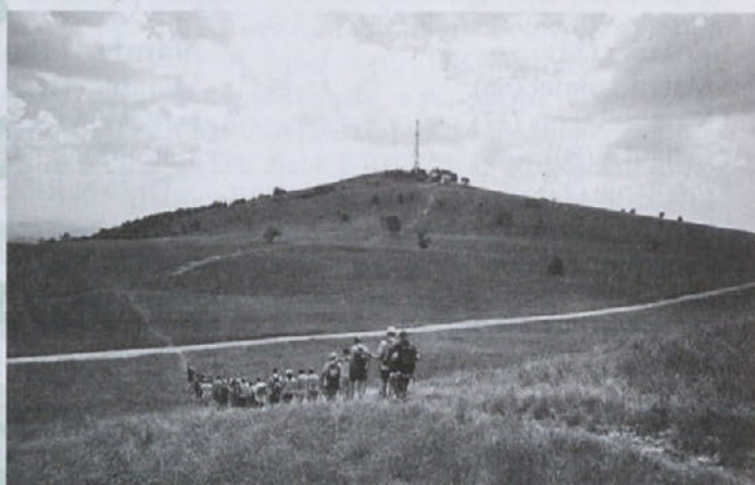
Naša „četica“ se vzpenja na Slavnik

Haloški planinski poti, ki ga vsako leto organizira PD Ptuj. V lepem majskem dnevu smo prehodili nekaj ur dolgo pot iz doline potoka Vundušek preko Bolfenka in Kupčinjega Vrha na Donačko goro, kjer je bila osrednja prireditev PD Ptuj.