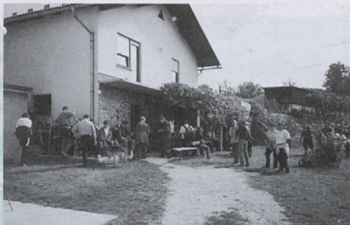
Haloška idila dopolnjena s pečenimi kostanji in dobro kapljico pred Planjšekovo domačijo

V okviru tradicionalnega Kostanjevega piknika smo žetalski planinci v tem letu organizirali pohod po Ekološki poti. Pohoda se je udeležilo 50 občanov občine Žetale. Na poti smo se ustavili na treh točkah, ki je vsaka s svojo kulinariko pripomogla k prijetnemu in nepozabnemu druženju. Pečeni kostanji, haloška gibanica, dober