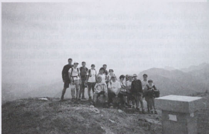
Gasilska slika na vrhu Golice

Naslednji pohod smo namenili spoznavanju našega skega sveta, naš cilj je bila 1835 metrov visoka Golica, eden izmed najvišjih vrhov zahodnih Karavank. Sproščujoča in ne preveč naporna pot se je vila skozi gozdove in planinske pašnike do kočice na Golici, od katere smo se po polurni hoji povzpeli na vrh Golice. Lepo vreme nam je na vrhu nudilo slikovit pogled na reko Dravo, Vrbsko jezero, Osojsko jezero in Celovec.