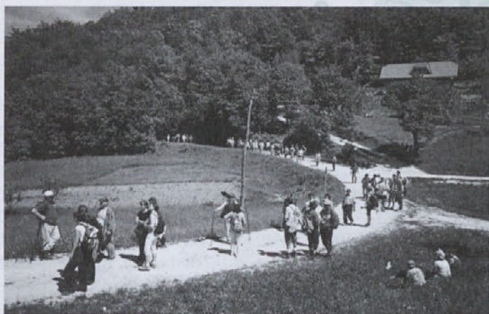
Počitek in nabiranje novih moči pred vzponom na „haloški Triglav“

Planinsko društvo Žetale je v iztekajočem letu organiziralo tri pohode. Nekaj članov našega društva se je pri osvajanju in spoznavanju lepot naših gora priključilo PD Majšperk in PD Stoperce.