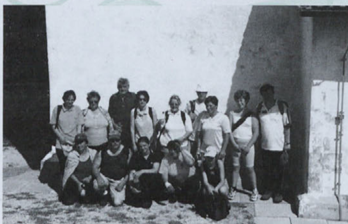
Skupinska slika članov PD Žetale pred cerkvijo sv. Bolfenka

31. maja 2003 smo se žetalski planinci pridružili številnim planincem iz sosednjih društev na 12. pohodu po