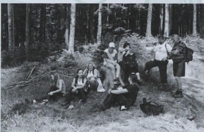
Nabiranje novih moči sredi pohorskih gozdov

V začetku julija smo se odpravili na vzhodno Pohorje, kjer smo po planotastem in mokrotnem površju dosegli najvišje točke vzhodnega Pohorja (Rogla -1517 m, Klopčev vrh - 1340 m in Žigartov vrh 1364 m). Zaradi prijetne in sproščujoče hoje po številnih barjih ter lepega gozdnega biotopa smo se odločili, da bomo v prihodnjem letu prehodili še zahodno Pohorje.