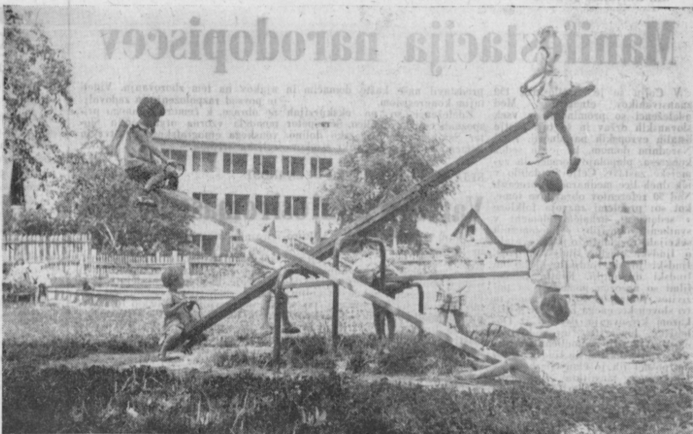
MEDTEM KO NEKATERE V TEH DNEH MUČIJO SKRBI S SOLO, SE DRUGI LAHKO ŠE SPROSCENO PREPUŠČAJO IGRI IN ZABAVI. VSE DOKLER...

Značilno je, da recimo na področju celjske očine sploh ni pregleda nad štipendisti, prav tako pa tudi, da po mnogih zelo jasnih stališčih ustreznih forumov (zlasti v lanskem letu), po katerih naj bi pomenile investicije v kadre malone osnovo ekonomike, ostajamo tam, kjer smo bili, potemtakem celo še na slabšem. S tega vidika je omembe vreden predlog z zadnje seje sveta za šolstvo, da bi v tem mesecu priredili posebno posvetovanje, kjer bi obravnavali vse te probleme, skušali ugotoviti dejanski položaj ter priti do jasne orientacije na tem področju.