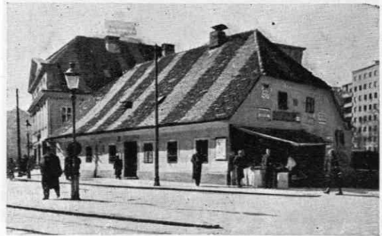
Stari »Figovec« z uličnimi kandelabri

Prižigalcem ni bilo več treba snažiti svetilk in nalivati olja, marveč so na dolgih drogovich