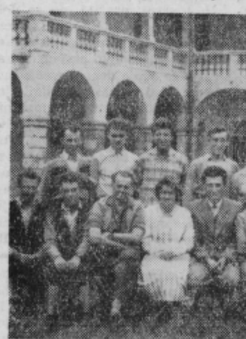
Prvi absolventi dvehletne specializirane kmetijske šole v Turnišču pri Ptuj z nazivom kvalificirani delavci kmetijstva. Šola bo z novim šolskim letom prešla v srednjo kmetijsko šolo in bosta tu prva dva letnika. V Mariboru vpisa v prvi in drugi letnik ni več. Vpis v šolo Turnišče traja do 31. julija 1960. Kmečki fantje in dekleta, ne zamudite vpisnega roka!

Ko so postali delavci samoupravljalci v podjetju, so pokazali veliko zanimanje do dela in do izdelave kvalitetnejših proizvodov. Organizacija dela se je znatno izboljšala, saj se iz leta v leto izboljšujejo delovni pogoji. Delavski svet je igral pomembno vlogo pri izdelavi tarifnih pravilnikov ter vseh ostalih pravil in pravilnikov, ravno tako pri razdeljevanju osebnih dohodkov in sprejemanju zaključnih računov.