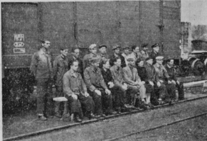
Železniške del. Ptuj: prvi delavski svet na občinskem območju

Delavci danes sami odločajo o notranjih odnosih, svobodno in samostojno razpravljajo o najbitnejših vprašanjih kolektiva. Razvito delavsko samoupravljanje pomembno vpliva tudi na razvoj vseh družbeno ekonomskih odnosov v komunah, na ustanavljanje in razvoj vrste ustanov, s pomočjo katerih delavski razred in ostali državljani neposredno odločajo in vplivajo na družbena dogajanja.