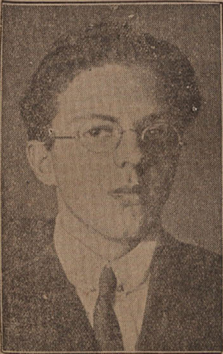
Ob sedmi obletnici smrti Srečka Kosovela.

Veliko črnila se je že zšlo na papir, ogromno besed se je že prevadilo iz ust in neštetih src je že vztrepetalo ob pesmi Srečka Kosovela. Kaj naj še rečemo mi, ljudje iz Primorske krajine, o njem?