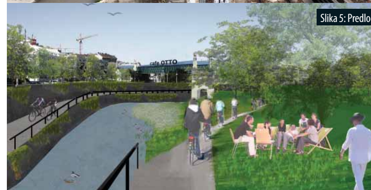
Slika 5: Predlog