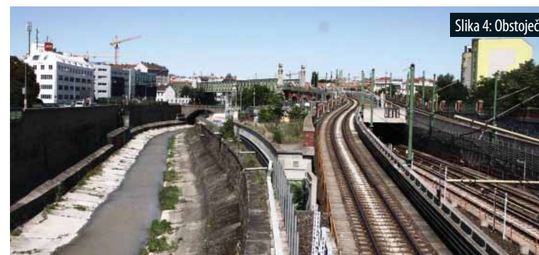
Slika 4: Obstoječe