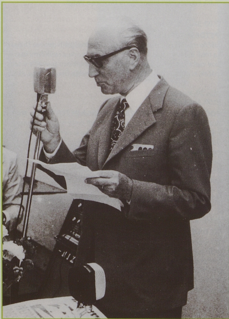
Jože Peterlin med otvoritvijo osmih študijskih dnevvov 1. septembra 1973.

50. Draga pa seveda ne more mimo samospraševanja o svoji preteklosti: štirje nekdanji udeleženci iz matice, zdomstva in zamejstva bodo skušali odgovoriti na vprašanje, ali se je splačal dosedanji napor, s katerim je tržaški krog kulturnikov ponujal pripadnikom vseh treh Slovenij okolje, da prosto razmišljajo in razpravljajo o problemih, ki so relevantni za obstoj naroda in njegov razvoj.