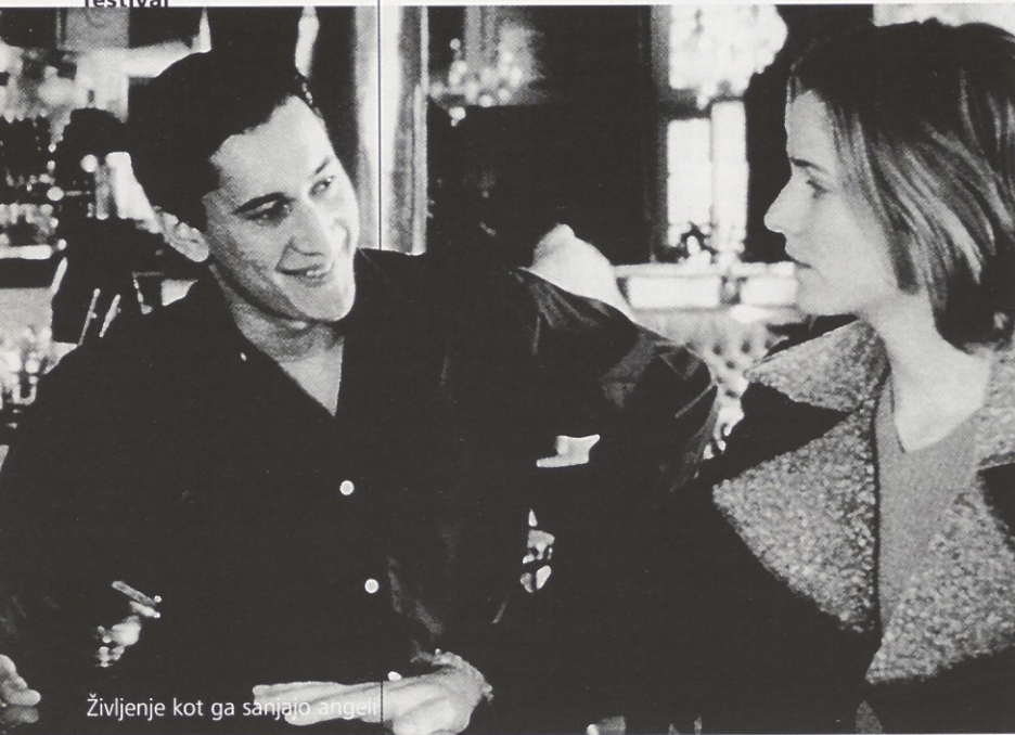
Življenje kot ga sanjajo angeli