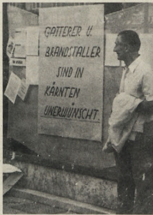
V istem tonu napisan letak leta 1975

Na sliki je še en dokaz, da se koroški Slovenci od večinskega naroda razlikujemo samo po jeziku. In niti po kulturi ne.