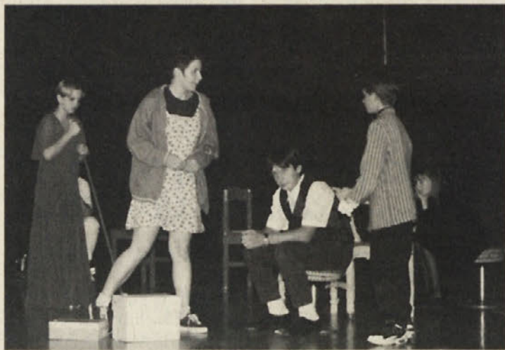
Dijaki v odrski predstavi s kritično vsebino