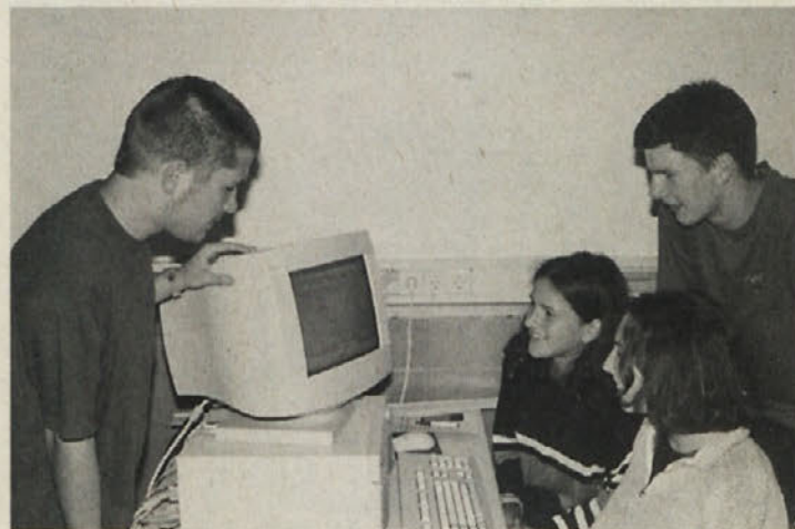
Dijaki pri surfanju po internetu

Vedno več ljudi se poslužuje elektronske mreže internet. Pretekli teden so dijaki in dijakinje na gimnaziji lahko spoznali to informacijsko ponudbo, povezavo s Kleine Zeitung (provizor) pa je posredovala avstrijska pošta, ki je prevzela tudi stroške. Za večino je bilo surfanje po internetu nekaj povsem novega, a mikavnega.