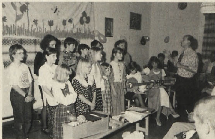
Kočanski šolarji so zapeli