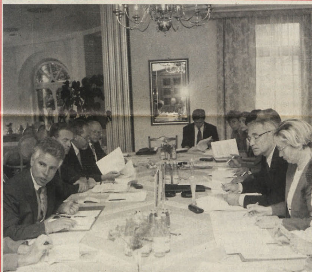
Izčrpnih pogovorih med političnimi predstavniki Slovenije in Koroške so potekali v Celovcu v očitno zadovoljstvo obeh partnerjev, ki usklajujeta vprašanja, zadevajoča obe državi

550 raznih avstrijskih podjetij ima že svoje podružnice v Sloveniji. Str. 2