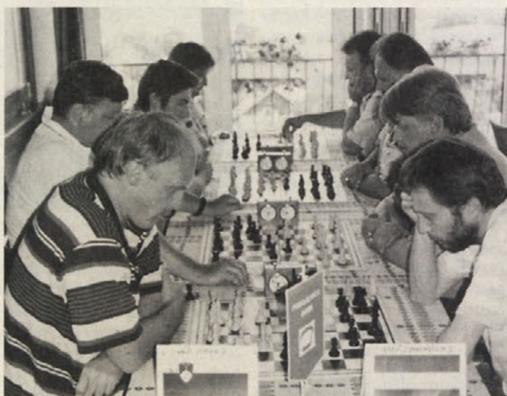
Napeto na mednarodnem turnirju SŠZ

Jubilejni turnir je potekal po pravilih Mednarodne šahovske