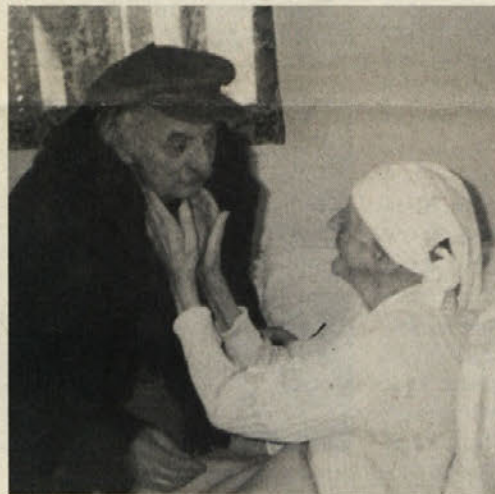
Ob Milkinem 95. rojstnem dnevu 10. 2. '97

»Kod se potepata, čakamo samo še na vaju. Le kaj vama ne pride na misel – pluti po zraku, ko se je vendar Hitler napovedal na obisk. Sporočili so, da bo zdaj zdaj tu. Iz mesta se bo pripeljal. Hitro se uvrstita!«