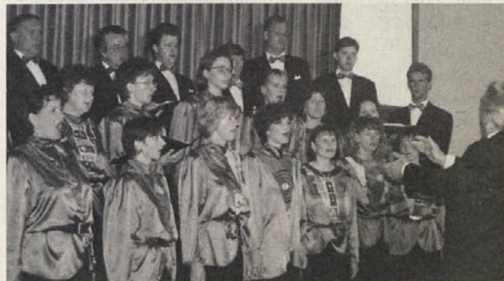
Mešani pevski zbor »Podjuna«