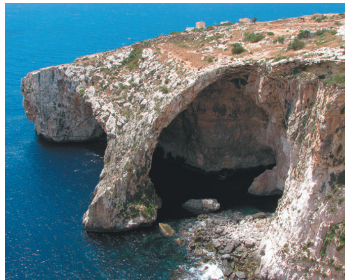
V Modro jamo se je mogoče zapeljati s čolnom.

Kljub na prvi pogled sodobni in odprti družbi so na Malti trdno zakoreninjene tradicionalne vrednote. Nekateri tudi s pomočjo zakonov, med drugim sta prepovedana in sankcionirana abor-