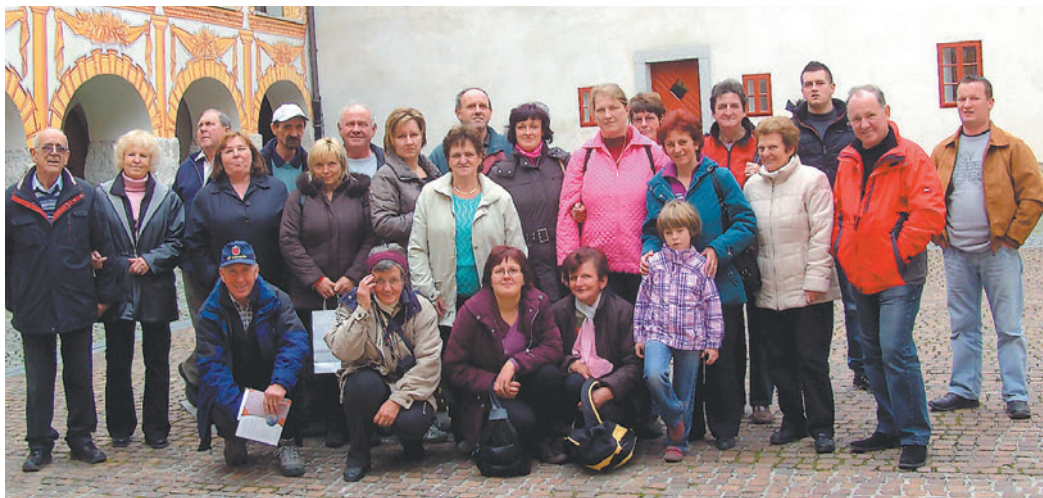
Na dvorišču idrijskega gradu.

Na pot smo se podali z manjšim avtobusom prevoznikstva Vrankar ob 7. uri iz Motnika in po dobrem jutranjem prigrizku, ki so ga pripravile odlične motniške gospodinje, v Dolenjih No-