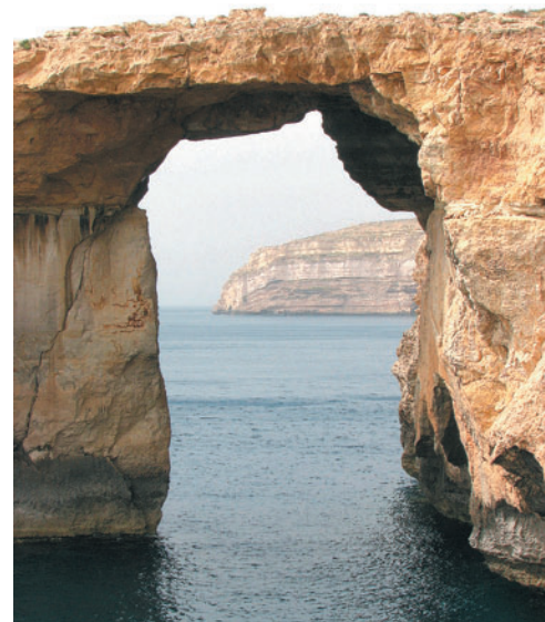
Azurno okno je ena največjih zanimivosti Goza.

Večji del otokov je skalnatih, poraslih le s travo in grmičevjem ter kakšnim borovcem. Drevesa je praviloma mogoče občudovati le v parkih in vrtovih. Temperature na apnenčastih planotah se