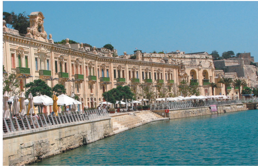
Obnovljeni del pristanišča v Valletti.