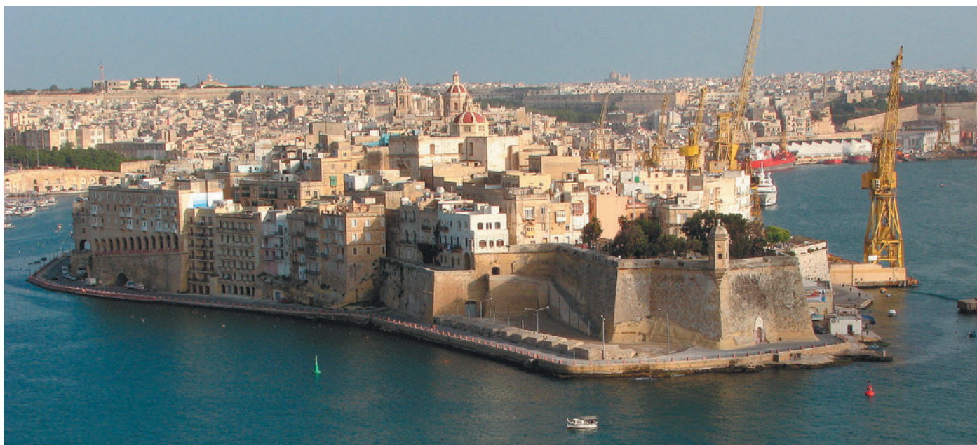
Z obzidjem je utrjena tudi okolica prestolnice.

ha. Toda registracija in cestnina za motocikel ni dosti cenejša kot za avtomobil. Nič čudnega, da si družina raje omisli dva manjša avtomobila... Tudi zato, ker so avtobusne povezave precej slabe. Še posebno, če ne živiš v bližini pristanišča ali glavnega otoškega mesta.