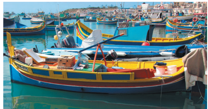
Značilni malteški čolni so za ribiče del vsakdana.