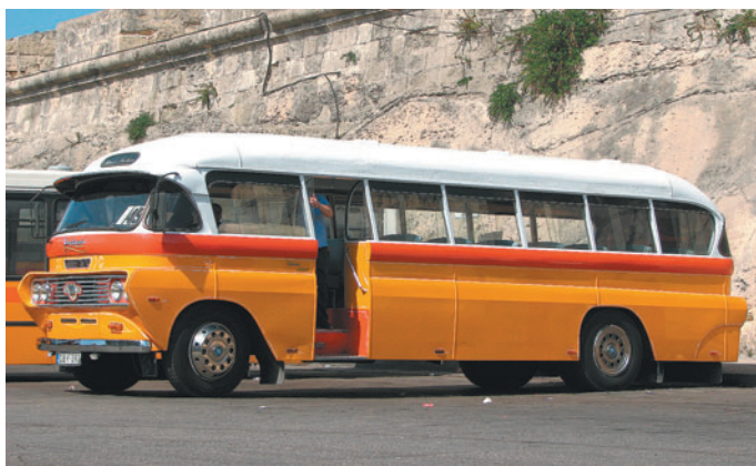
Kakšno vožnjo je vredno narediti z lokalnim avtobusom.

Prvo kar pade v oči na Malti so razkošne cerkve, palače in