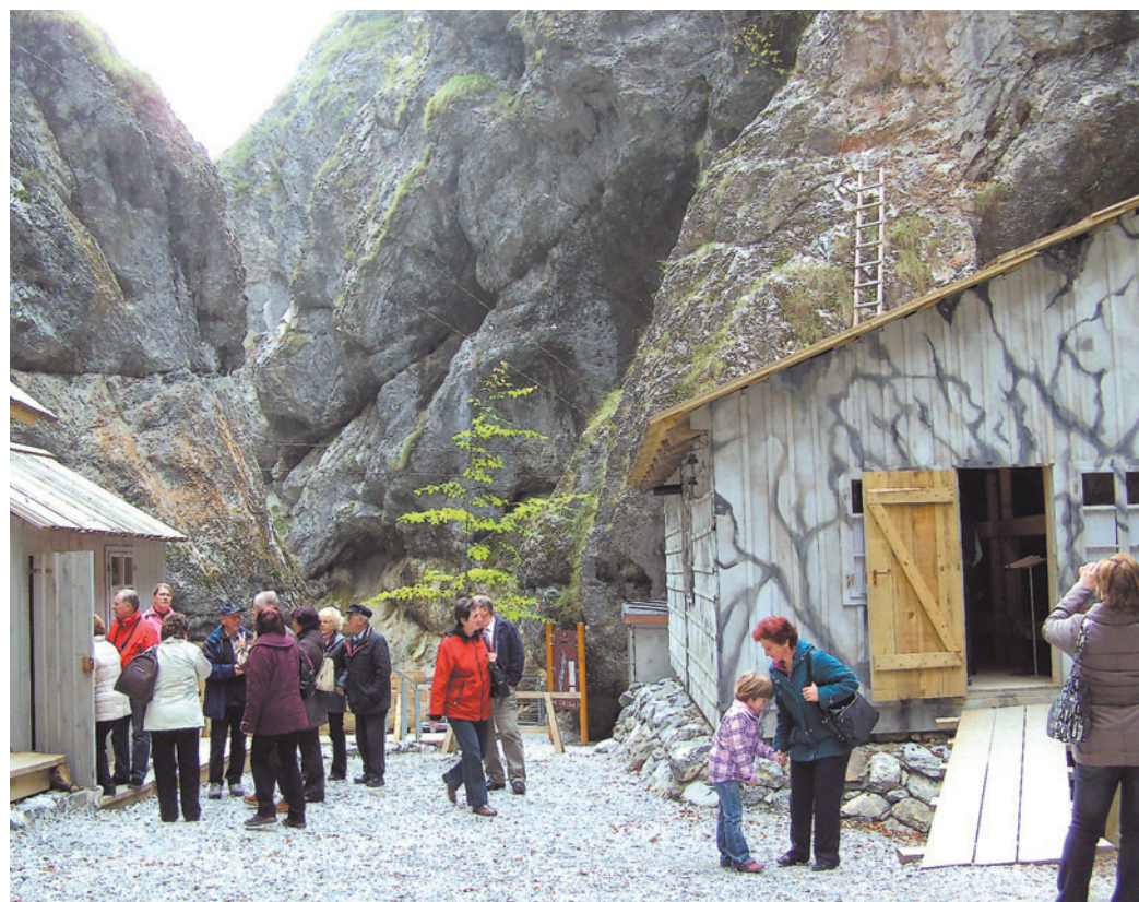
Partizanska bolnica Franja je skrita v slikovito sotesko reke Pasice.

Ijena po hudi ujmi septembra 2007, ko je deroča voda razdejala kanjon ter odnesla glavino barak in razstavljene originalne opreme. Kot smo lahko razbrali iz opisov dogajanja med vojno v zdaj že obnovljenih barakah, se je tu za pomoč ranjencem izkazovala neizmerna srčnost in požrtvovalnost tako soborcev, ki so ranjence prenašali v nemogočih razmerah po vodi in skalah do skritih in bornih barak, kot tudi zdravnikov in spremljajočega osebja.