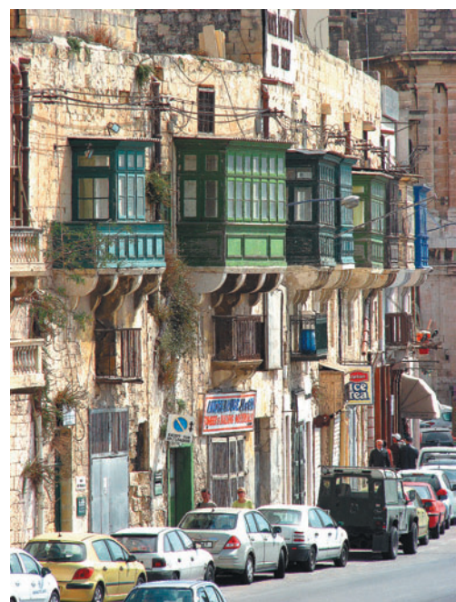
Slikoviti malteški balkoni nad ozkimi ulicami.

Malo težje pa se je bilo sprijazniti z divjaško razpoloženimi domačini, množico krožnih križišč in pomanjkljivimi smerokazi. Semaforjev premorejo le za vzorec. Otočani skoraj enako hitro švigajo po večpasovnicah kot po ozkih enosmernih ulicah in vožnja med njimi ni prav prijetna. Še huje pa je, ko želiš poiskati parkirni prostor. To je zahtevna naloga že za domačine, kaj šele za tujce! Nič čudnega, da je vedno bolj priljubljen sistem