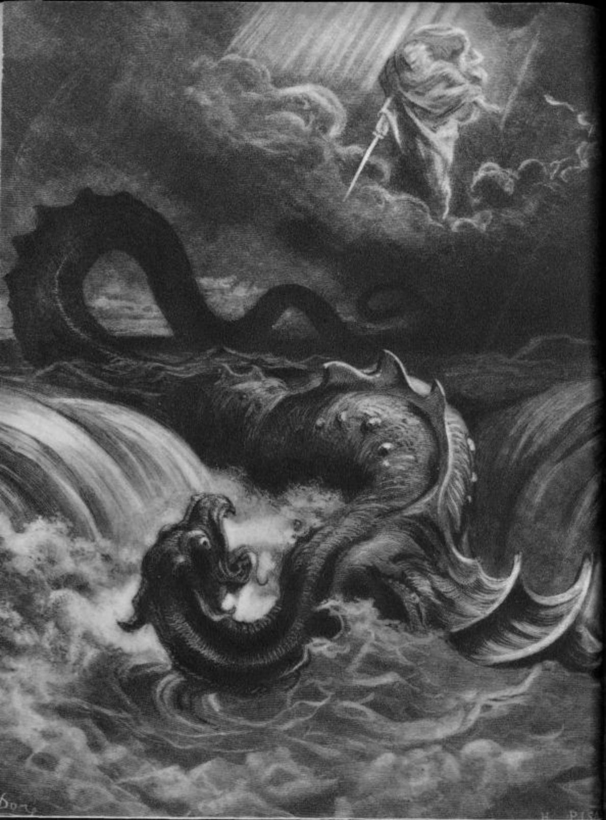
Izaja prerokuje sovražniku božjega kraljestva pokončanje. (Iz 27,1.)