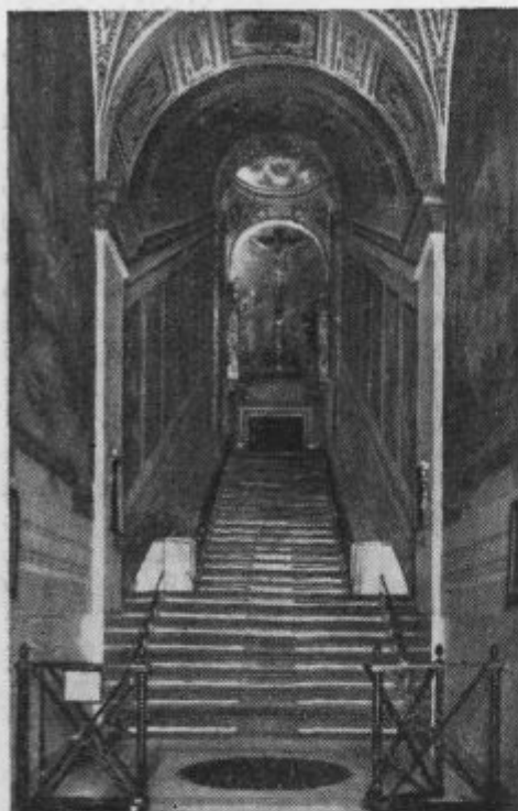
Svete stopnice v Rimu.

ob njih še ne zavrela ne. Žena mu je morala drva jemati na skrivaj, če je hotela skuhati, kot je prav. A gorje revici, če jo je zasačil. Z vrvmjo jo je privezal k jaslim in jo tepel z jermenom.