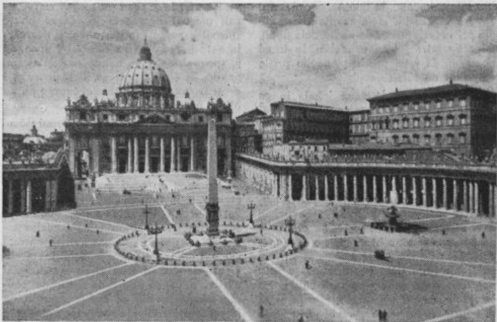
K II. obletnici papeževga kronanja: Bazilika sv. Petra z največjim trgom na svetu.

cesti naprej, da ga Mlajč ni videl nikoli več.