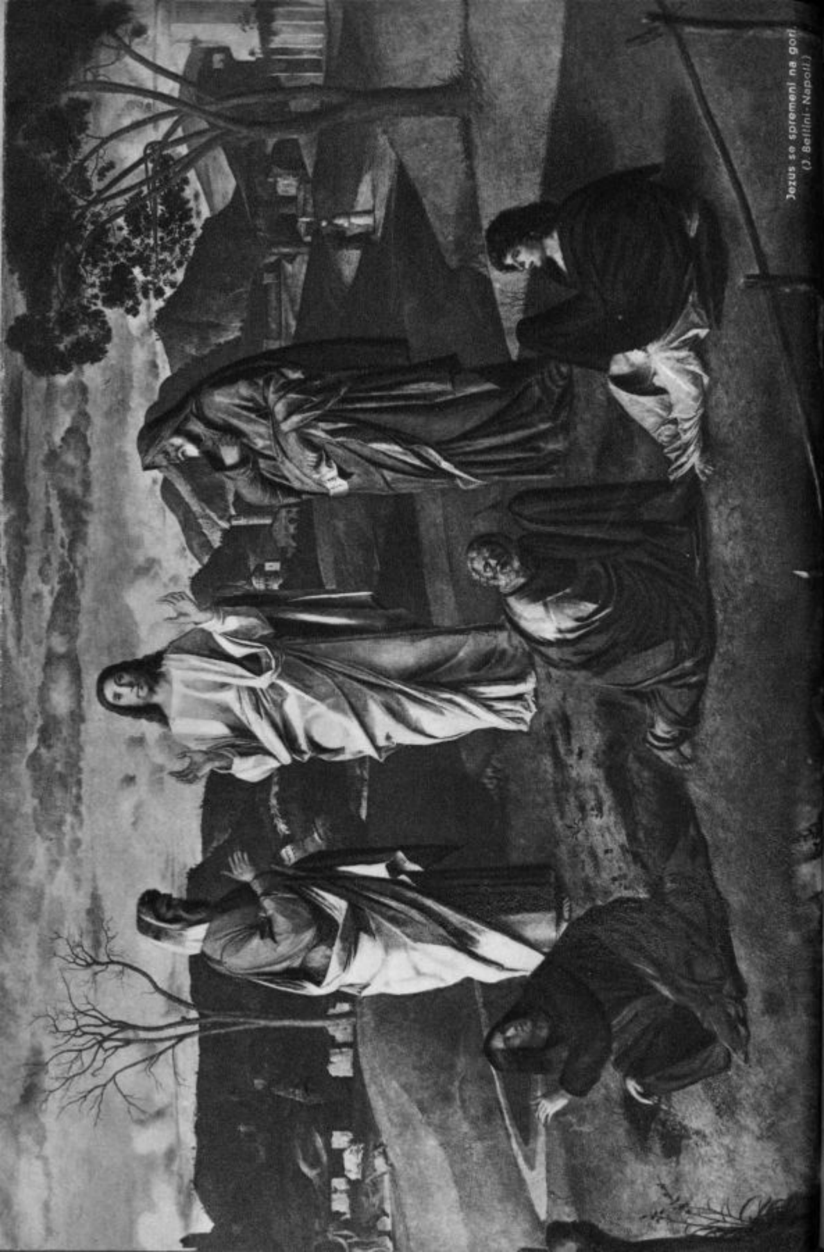
Jozus se spremlja na goji. (J. Bellini - Napoli.)