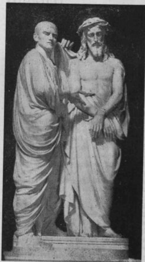
»Glej človek!« (Soha ob sv. stopnicah.)

Izredno lepa postava tega visokošolca je zbujala pozornost marsikatere gospodične. Čutil je to, pa mu ni bilo v srečo. Marljivost je pojemala; komaj, komaj je toliko zaslužil, da je šlo naprej. Pri preskušnji na univerzi je bil odklo-