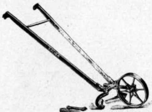
Pod. 44. Ročni okopalnik.

težakov. Zato vidimo, da rabi on skoraj povsod stroje. Podoba 49. pokaže ti pripravo, ki mu služi za okopavanje vrtine. Ker ne more rabiti tu živine, ne more rabiti tudi večih priprav, zato se poslužuje ročnih, katere poriva pred sabo. Delo je jako dobro in delavci delajo s tem mnogo rajši nego z mo-