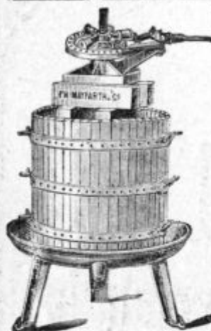
Stiskalnica za vino.