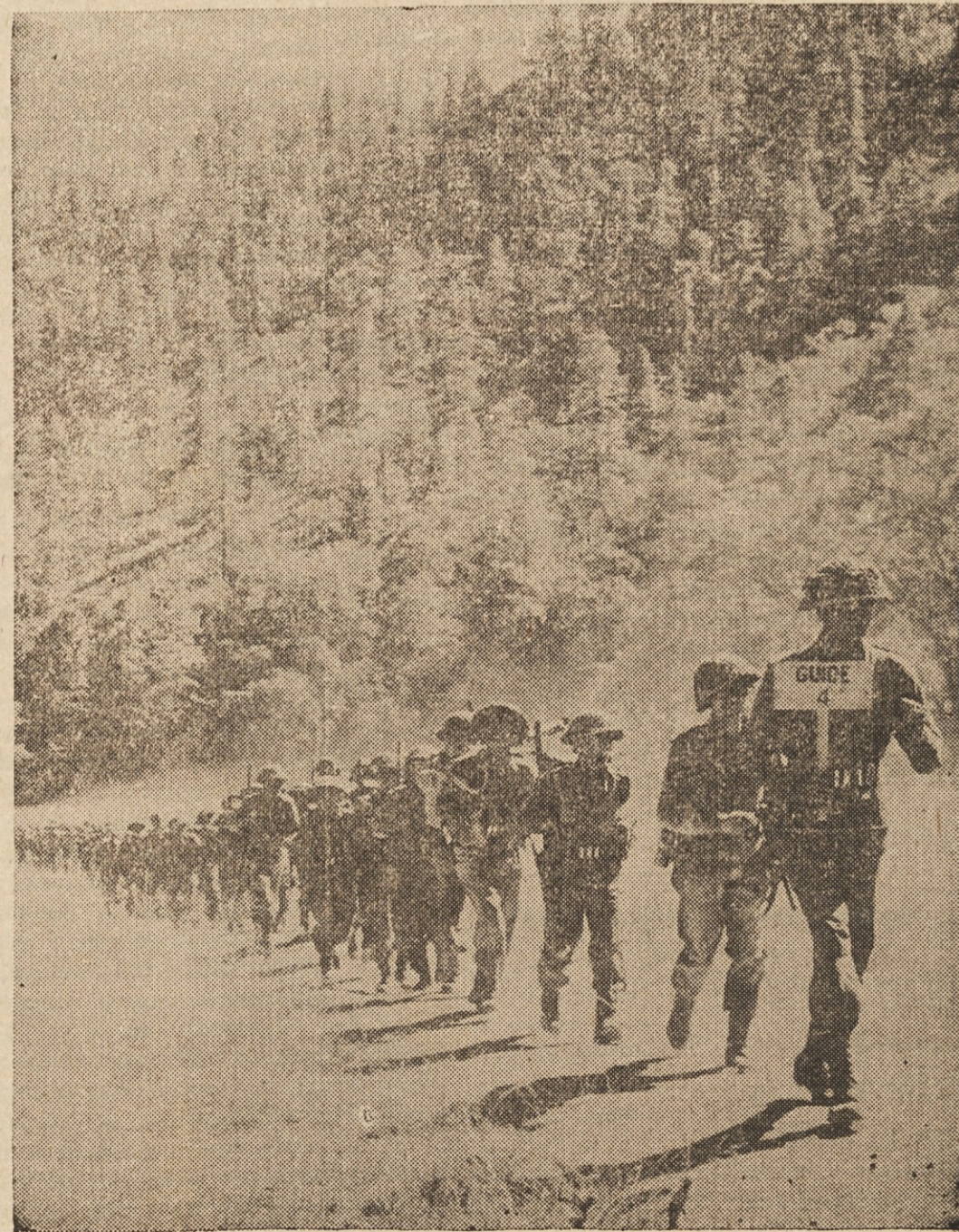
NA PATROLI V HIMALAJSKIH GORAH — Slika kaže močno patrolo indijskih gorskih vojaških oddelkov pri nadziranju indijsko-kitajske meje v Himalajskih gorah.