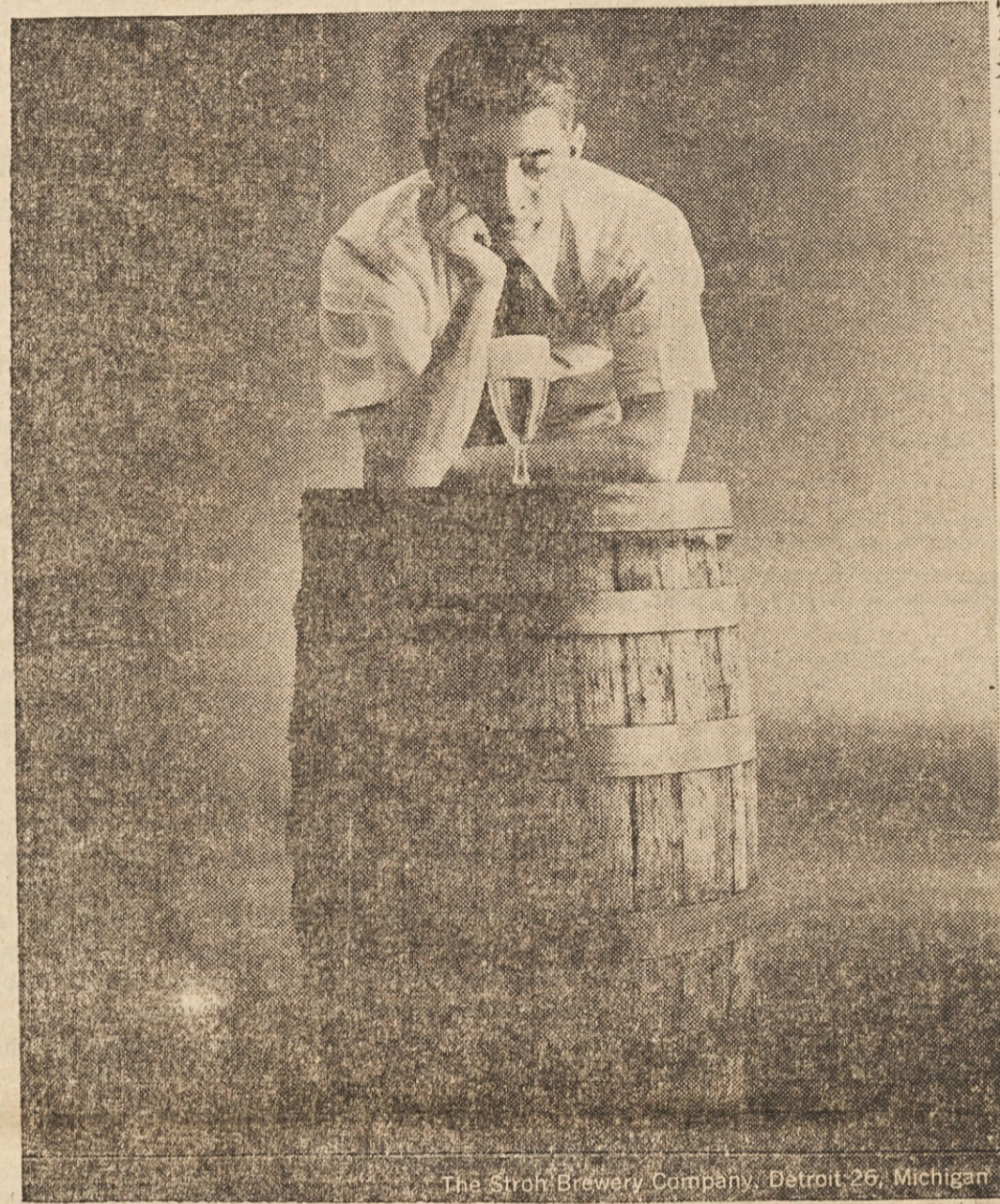
The Stroh Brewery Company, Detroit 26, Michigan