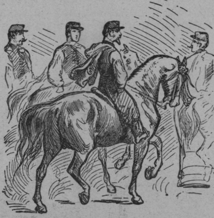
Čelo banderija kralomestského.