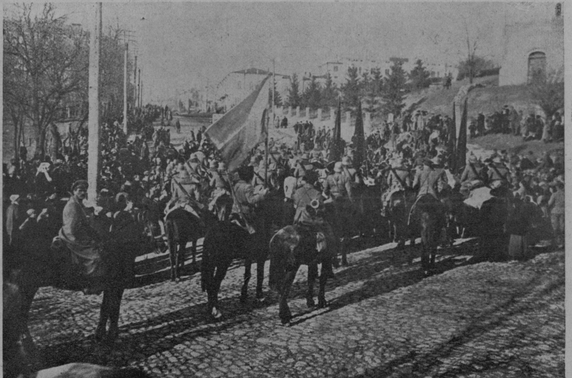
Iz Kamenca Podolskega: Pogreb avstrij. vojaka, ki so ga ubili ukrajinski boljševiki.

Pol ure nato se je voz ustavil pred velikim, vojašnici podobnim, odurno umazaniam poslopjem. Vojaki so odprli železna