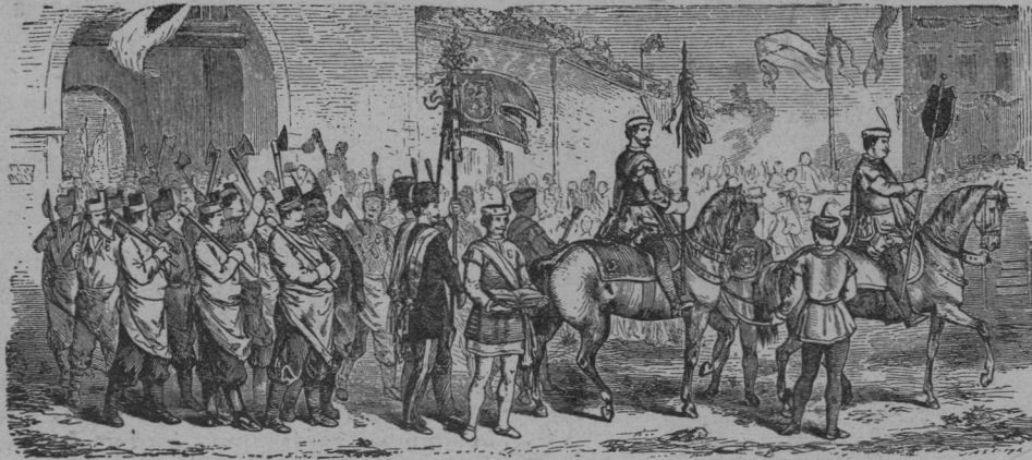
Pražski mesarji v slavnostnem sprevodu 16. maja 1868.

sv. Janeza Nepomuka. Po starem sporočilu so vrgli Janeza Nepomuka v „to reko Vltavo“ — kakor poje naša narodna pesem, zaradi spovedne molčečnosti. Truplo Janeza Nepomuka leži v srebrni krsti v cerkvi sv. Vita na Hradčanih in narod prihaja tja na božjo pot.