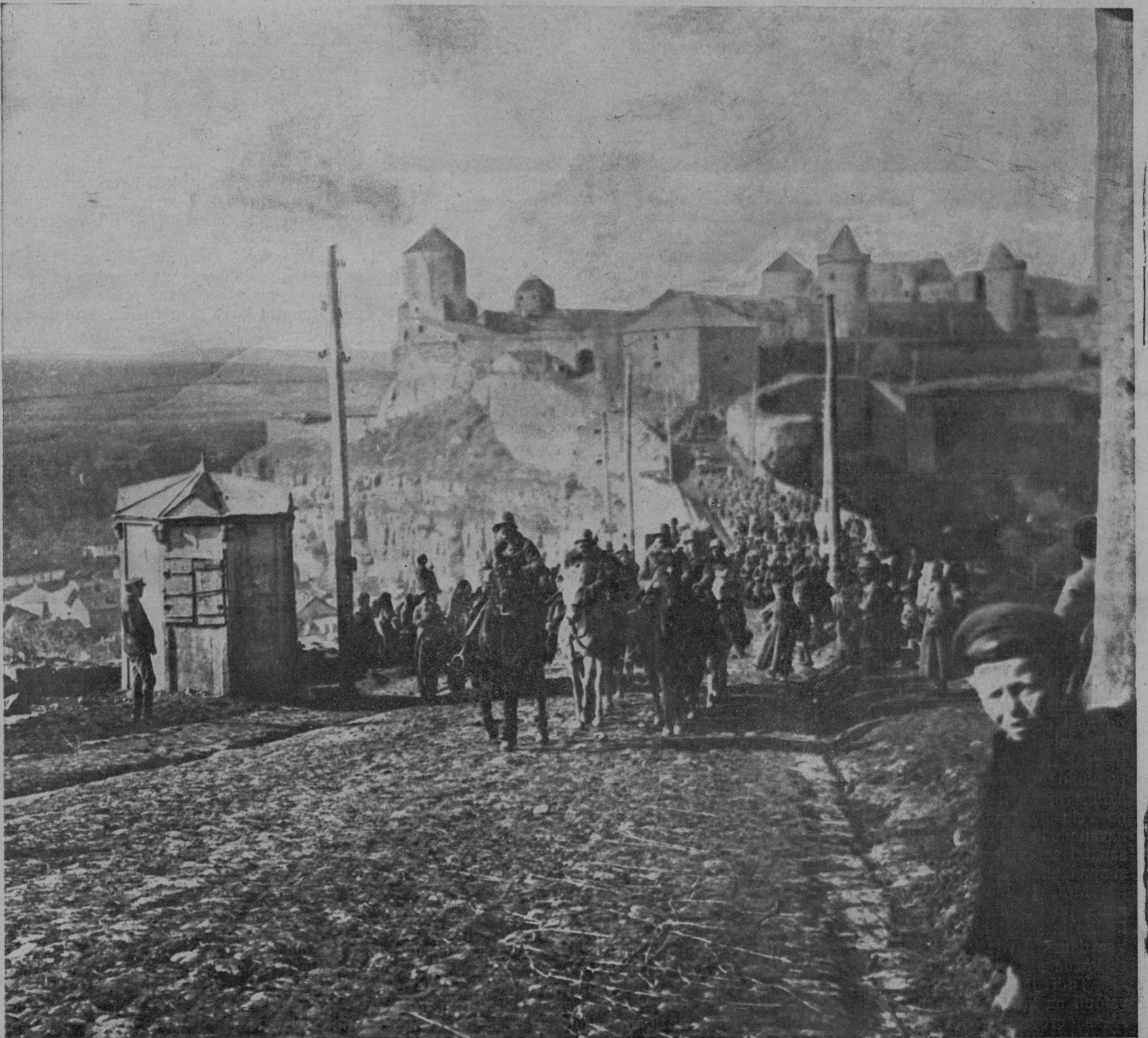
Naša vojska v Ukrajini: Pred Kamencem Podolskim.