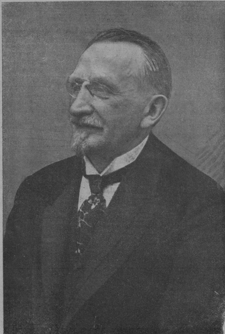
Ravnatelj opere Narodnega divadla, kapelnik Karel Kovařovic, skladatelj opere „Psoglavci“ in „Na bédidě“, ki je vodil velika koncerta gospodične Eme Destinnove 21. in 22. aprila v „Koncertnem domu“ na Dunaju. Ob ogromni udeležbi dunajskih Čehov je dirigiral orkester Nar. divadla praškega. Dunajski Čehi so sklenili, da si zgrade na Dunaju veliko češko gledišče!

godbo in velikim praporom; po teh so prišli jezdec Sokoli s francoskimi čepicami, za njimi pa so korakale med trobentanjem 9 trobačev trume Sokolov, 14 sokolskih društev z 8 zastavami. Praškega Sokola je vodil sam načelnik dr. Miroslav Tyrš. Nato so korakali in jezdili češki obrtniki: najprej praški mesarji, nato pivarniki (sladarji), pa sodarji, usnarji, jirharji in kožuhovinarji, potem cukrarji, slaščičarji, čokoladarji, klobučarji, vrvarji, zlatarji, nožarji, mečarji, puškarji, steklarji, pa krojači, za njimi študentje in mlinarji, tipografi (tiskarji in stavci), ključavničarji, urarji, kovači, črevljarji, jermenarji ter še drugi »cehi«, a končno brivci in vlasuljarji. Za temi obrtniki, ki so bili vsi v slikovitih zgodovinskih nošah, z godbami, praporji in raznimi orodji, so korakale trume