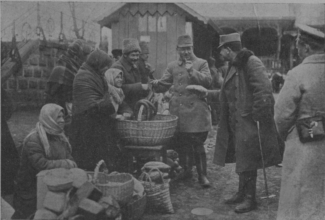
Branjevke v Ukrajini prodajajo našim častnikom razna živila.

Prišel je preko zamrznjene Njeve na Vasiljevski otok, si ogledal od zunaj vseu čilišče, akademijo lepih umetnosti, akademijo znanosti, prav posebno pa gigantsko borzo.