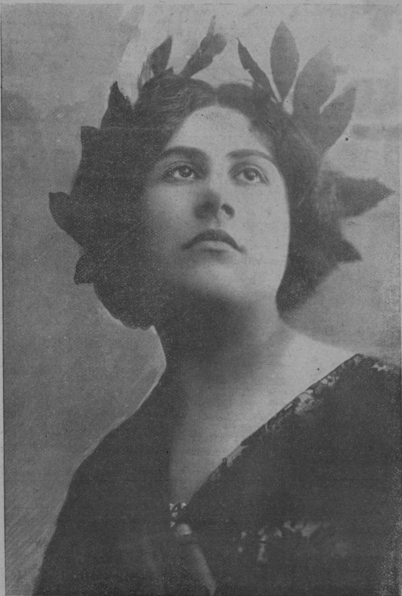
Najslavnejša, največja češka operna pevka, gdč. Ema Destinnová, bivša dram. pevka v Newyorku, bivša ces. komorna pevka berlinske velike opere, mnogoletna primadona Narodnega divadla v Pragi. Ker je odločna češka rodoljubka, so ji Prusi vzeli naslov ces. komorne pevke. Umetnica uživa med Čehi izredno priljubljenost ter bo te dni pri jubilejnih svečanostih v Pragi pela v operi „Dalibor“ ulogo junaške Milade.