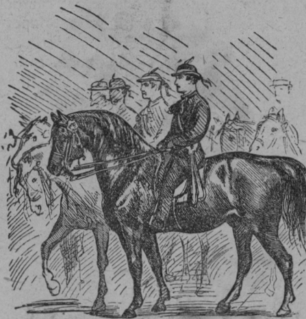
Čelo banderija uhrovskega.