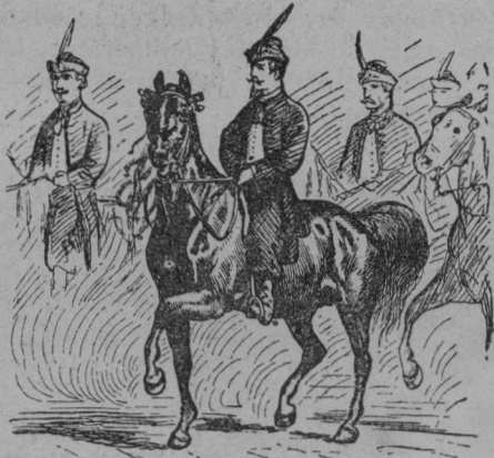
Čelo banderija kolinskega.

Letos slave Čehi 50 letnico onih slavnostnih trenutkov. S ponosom gledajo na uspehe svojega dela. V vseh gledališčih se prirejajo slavnostne predstave. K slavnostim 15. 16. in 17. so Čehi povabili vse brate