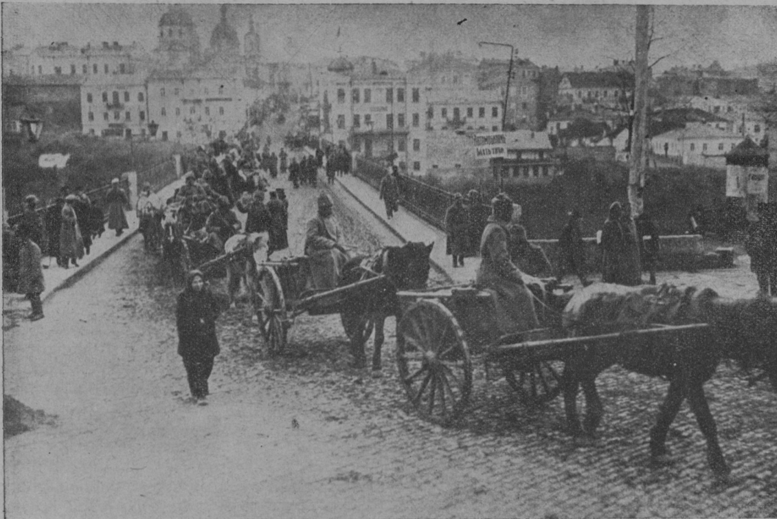
Naše vozatajstvo (tren) v ukrajinskem Kamencu Podolskem.

„V Moskvo. Tam sem doma — tam me pričakuje žena z otroci! — Ali hočete