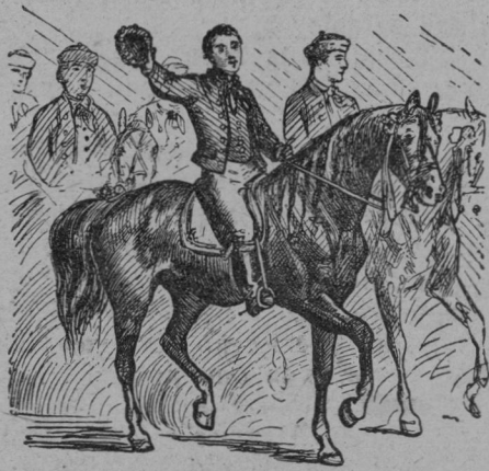
Čelo banderija benešovskega.

Čehi dramatično umetnost, — tudi v svojih najtežjih časih niso pozabili nanjo. Toda v prejšnjih časih to še ni bila ona prava velika narodna umetnost, — s katero so se danes Čehi proslavili po vsem svetu.