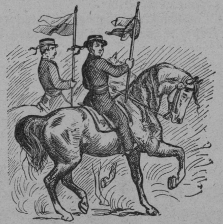
Čelo banderija hrudimského.