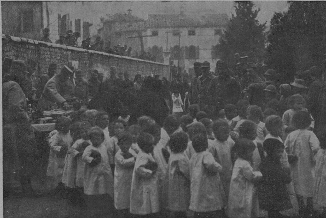
Iz obsedene Benečije: Naši častniki razdeljujejo na dan godu cesarja Karla med stradajoče benečanske otroke hlebkce koruznega kruha.