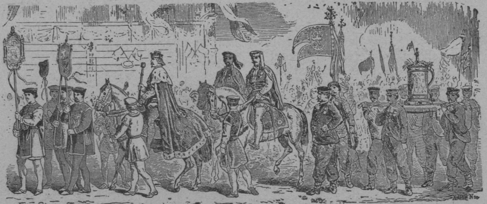
Pražski sladjarji (pivovarniki) v slavnostnem sprevodu: na čelu kralj Gambrinus.

Znano je, da se je prej vršila ta razsvetljava na čast velikega češkega reformatorja Jana Husa, ki je bil za svoje krščanske nauke sežgan l. 1415. na grmadi. Češki narod je smatral Jana Husa za svojega