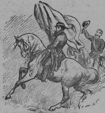
Čelo banderija karlinskega.

so se spominjali onih prvih časov, ko so se zbirali prvi prispevki. Možje, žene, otroci vse je hitelo na slavnostni prostor ob Vltavi, da se udeleže zgodovinskega dogodka. Narodnega gledališča niso stavili tu posamezni ljudje, — ves narod ga je stavil, da bi do-