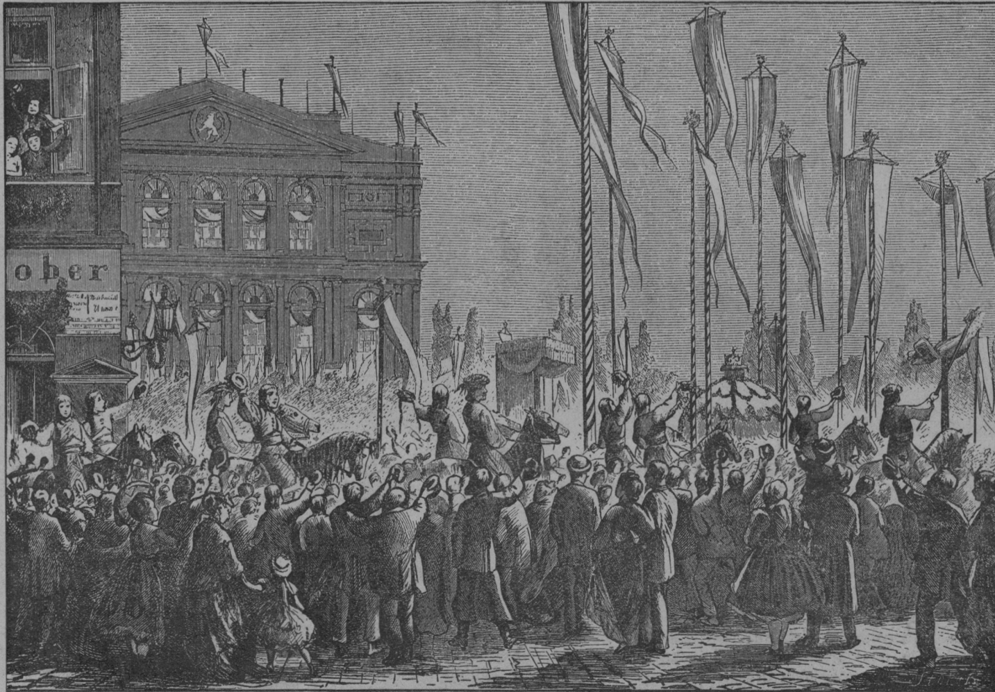
Sprevod gre mimo začasnega (lesenega) češkega gledališča in mimo stavbišča novega Narodnega divadla: Ljudstvo pozdravlja banderij Hanakov.

L. 1868. smo imeli težke čase. Letos jih imamo zopet. Kakor takrat so se sešli