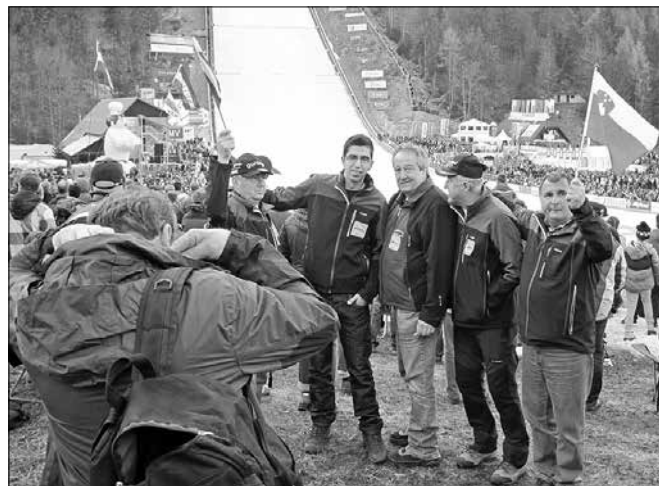
Ljubitelji Planice z Ljubnega