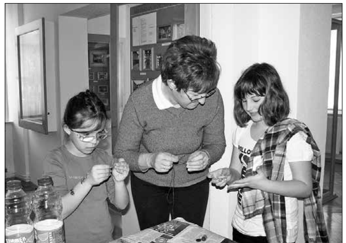
Osnovnošolski otroci so ustvarjali različne izdelke s svojimi mamicami ali babicami.

V času zimskih počitnic je Knjižnica Mozirje organizirala petdnevne ustvarjalne delavnice, ki so potekale v prostorih Muzejske zbirke Mozirje in Mozirjani. Skozi ves teden so se osnovnošolski otroci lahko družili ob petju, poslušanju ljudskih pravljic in zanimivem ustvarjanju.