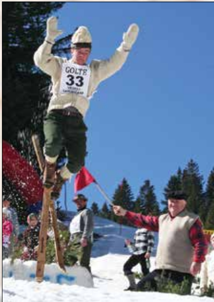
Mladi Podmeninski gad je smučarske skoke zamenjal za skoke na glavo.

Veseli Savinjčani, sekcija starodobnikov, ki delujejo v okviru Gornjesavinjskega smučarskega kluba Mozirje, so v soboto organizirali šesto