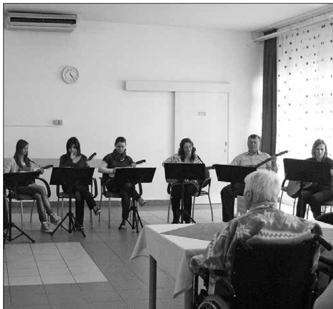
Tamburaši s Polzele so gostovali v centru starejših.

gostom zahvalila za obisk: »Praznik je postal z vašim nastopom, spoštovani gostje, še bolj prazničen. Hvala, ker ste mu dali veliko začetnico, hvala, ker ste današnje popoldne namenili druženju z nami, nam podarili melodije in prijetno razpoloženje. To je bilo čisto posebno darilo za vse naše stano-