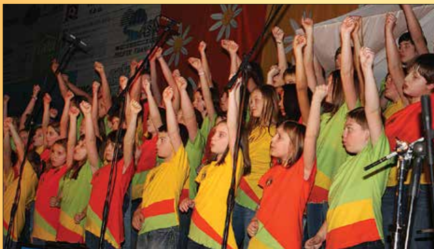
Združeni pevski zbor Osnovne šole Mozirje je občinstvu pripravil zanimiv program.