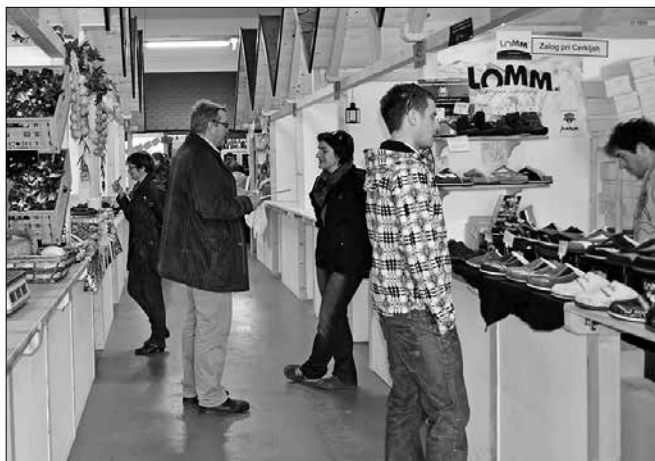
V Domači vasi so lahko obiskovalci videli, kako se trženja svojih izdelkov lotevajo drugi.

Največje zanimanje je vlada-lo za ogled Domače vasi v Kranju. Domača vas združuje prodajalce slovenskih domačih izdelkov in pridelkov na enem mestu. Na 600 kvadratnih metrih je postavljenih 63 hišk, ki dajejo pravi pridih domačnosti in občutek sprehoda po vasi z veliko ponudbo domačih iz-