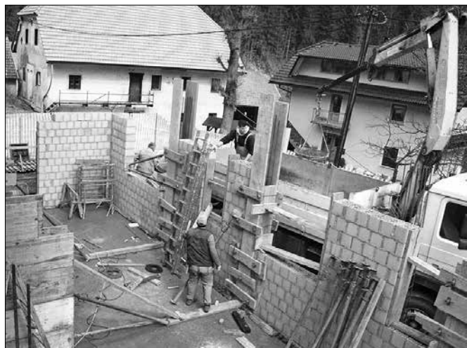
Objekt naj bi bil pod streho v kakem mesecu dni.