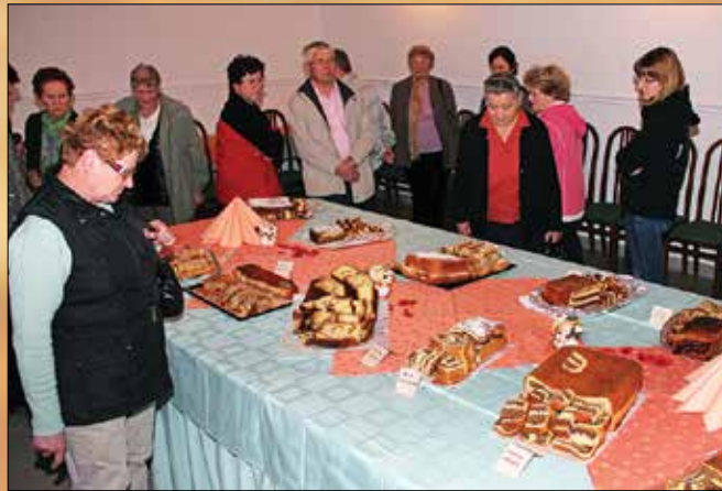
Ob zaključku ocenjevanja so lahko obiskovalci okusili, s kakšnimi dobrotami so se predstavile zgornjesavinjske mojstrice peke.

Natečaja se je udeležilo 17 mojstric v peki potice, ki so tekmovalle v treh kategorijah izdelkov, in sicer so se lahko predstavile z orehovo potico, potratno potico in ocvirkovko.