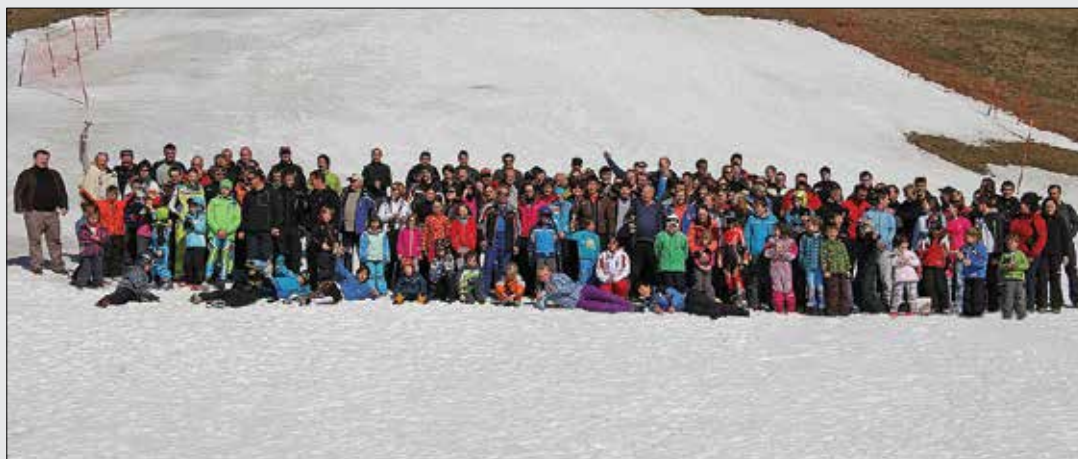
V Smučarsko tekaškem društvu Luče so bili s tekmo zadovoljni, saj se toliko tekmovalcev naenkrat na lučkem smučišču doslej še ni zbralo.

restavracija - sobe (Arja vas - Velenje) tel.: 03 714 80 60 Marjola - malice (Žalec - center) tel.: 03 710 37 30