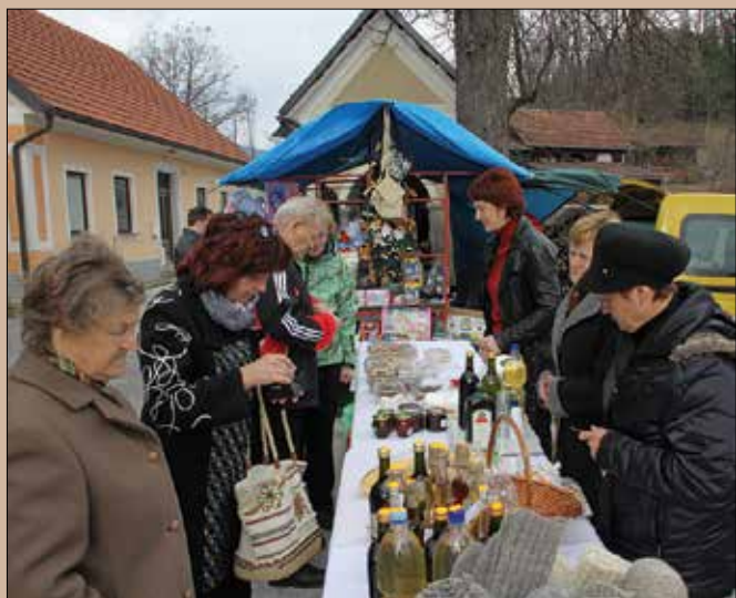
Stojnica društva Komen je vedno oblegana.