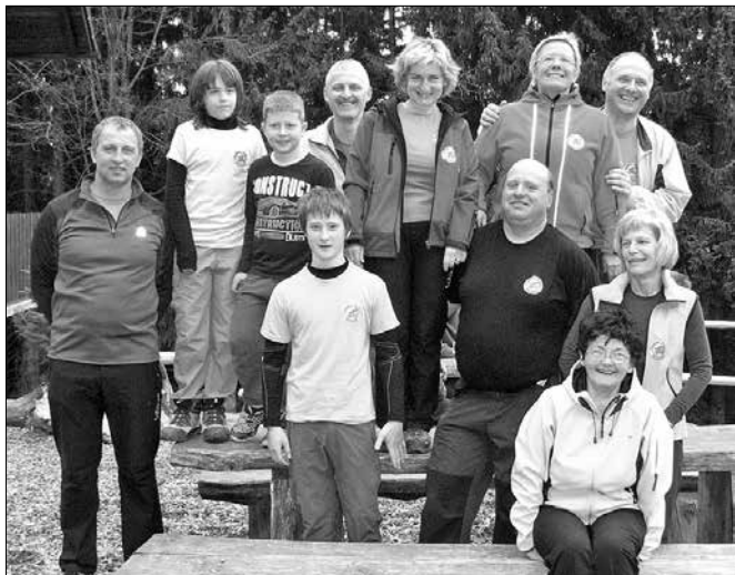
Prva mesta v večini kategorij so zasedli člani Planinskega društva Nazarje.

V soboto, 10. marca, se je na območju Spodnjega Pobrežja odvijala druga orientacijska tekma lige Smrekovec, v okviru katere se združujejo planinska društva Savinjsko-Šaleške regije. Tekma, ki se je udeležilo 33 ekip iz Rečice ob Savinji, Nazarje, Velenja, Vinske Gore, Šoštanja in Mozirja, je potekala v organizaciji Planinskega društva Rečica ob Savinji.