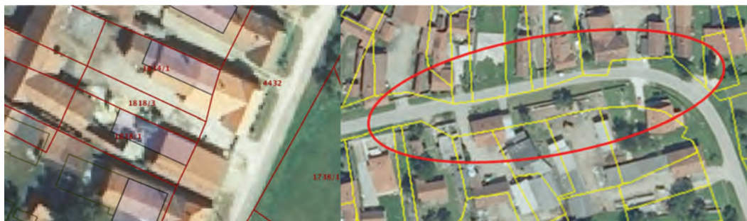
Slika 1: Neskladje med DKN in DOF na levi ter anomalije na stikih listov na desni.

Pri vektorizaciji, ki se je izvajala med letoma 2000 in 2010, so nastale nove deformacije večinoma na stikih listov načrtov, pri vklopih prilog ipd. Obenem so bili načrti pretvorjeni v državni koordinatni sistem (takrat HDKS) s preračunavanjem robov listov z objavljenimi parametri (Borčič in Frančula, 1969), ki so pri številnih katastrskih občinah očitno približni (slika 1).