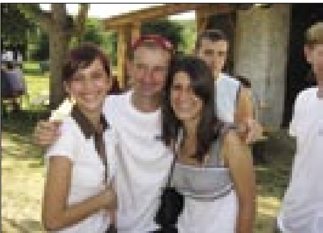
Andovski »legén« pa števanovske dekle

so nam obečali, dapa na gnes so ga že dolaprajli. Lüstvo de se vanej na sonci peklo. Električka se naura redi, iz pipe (csap) ne teče voda, reflektorov, žnjaur nejmamo telko, kelko bi trbelo. Špejk bi trbelo gorarezati, plin, krüj, stolice pa ešče Baug vej ka nam vse