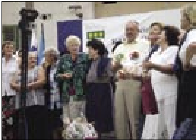
Z gostitelji na odri

Dostokrat čujemo od Slovencev v Sloveniji, ka lidgé v Ljubljani pa v bola dalečni krajaj spoj ne vejo, ka djé na svejti Porabje, ka taum, gde se srečajo trgé rosagi,