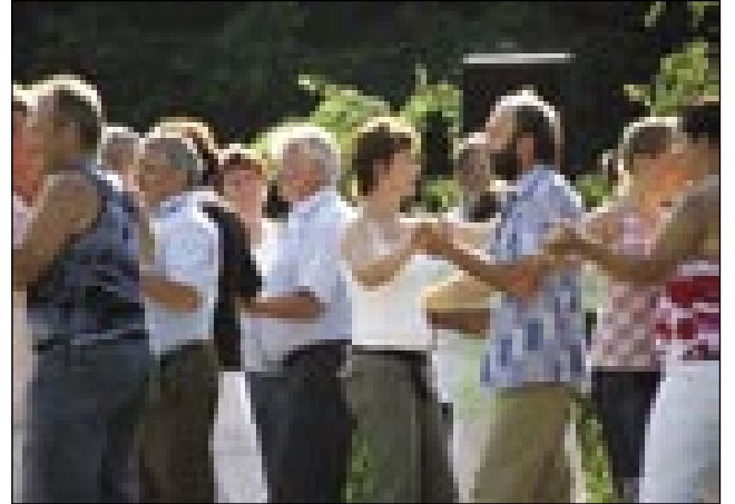
Steri radi plešejo, tistim se je nej štelo, če sunce sije

gda sam na oder pogledno. »Njegovoga vraga, vejpa nejmamo reflektora, ka bi na oder svejto,« si zdenem.