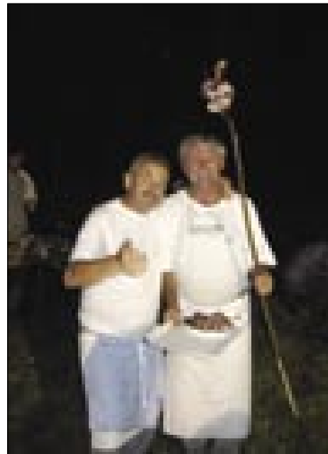
Naša küjara sta si večer sama mogla špejk pečti

»Vidiš, tau sam sto prajti, te gda si me nej njau,« pravi Kovačín Tibi. Dapa kak sam že dostakrat pravo, dojda pulonje stvari tanaprjati