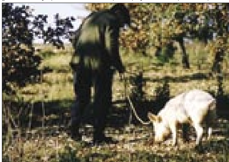
Djager na gobe med delom

Té pa nemajo takšoga žmaja kak burgundske, štere se leko septembra pa oktaubra berejo. Za te slejdnje leko na placi dobimo 70-100 gezero forintov za kilo. Leta 2003 pa fejst malo deži bilau, te so cejne zrasle v nebo. Najdrakše