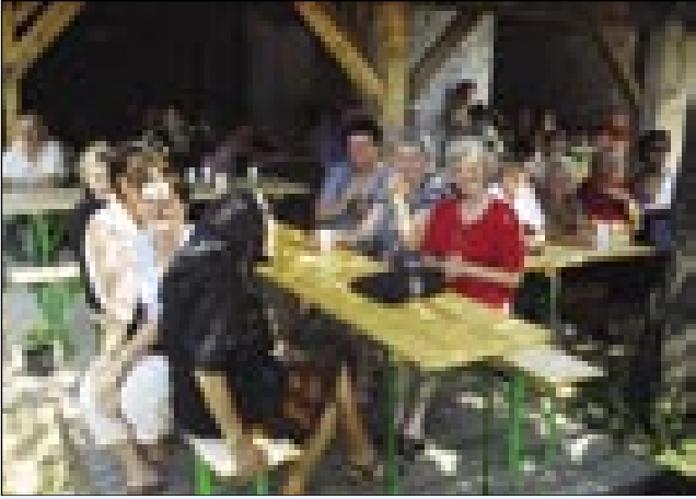
Gledalci so si iskali sejncu, naravno ali umetno, vseedno

ti, če sam sto ali nej: »Vejte ka, v velkom dreki smo. Oder ešče nej kreda, šator