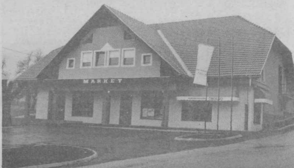
Stična je občinski praznik prinesel novo pridobitev: podjetje Tabor je odprlo lično samopostrežbo.