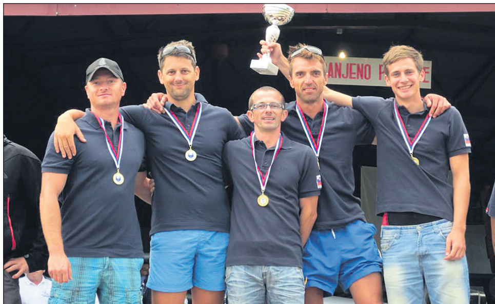
Zmagovalna ekipa Prijedorja – AK Ptuj

resno lotili organizacije tekme, izvedbe se ne bi sramovali niti organizatorji tekem za svetovni pokal. Tudi množica obiskovalcev se je do padalcev vedla kot do pravih malih zvezd: pozornost, ki je naši športniki niso ravno pogosto deležni.