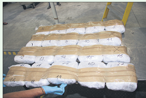
V tovarniško izdelanem dvojnem dnu v kombiju so trije Črnogorci tihotapili dobrih 20 kilogramov marihuane.

Z vstopom Hrvaške v EU in s tem zmanjšanjem nadzora na meji policisti pričakujejo povečan promet prepovedanih drog preko ozemlja Republike Slovenije, saj na sami meji med državama ni več carinske kontrole. Zato je možno pričakovati porast tihotapljenja prepovedanih drog, še posebej po tako imenovani »Balkanski ruti«.