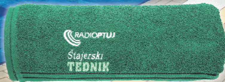
* slika je simbolična

Po lanski uspešno zaključeni akciji, v kateri smo iskali naj medicinsko sestro/medicinskega tehnika, smo se letos ponovno odločili pripraviti akcijo poletja, le da bomo tokrat izbirali