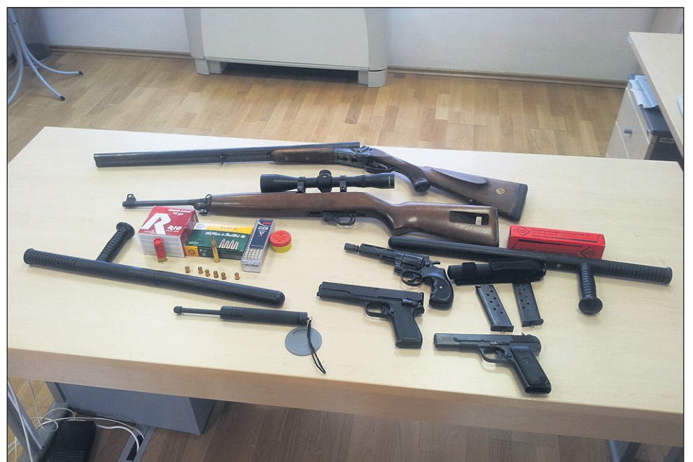
V Gorišnici so policisti zasegli več kosov orožja.