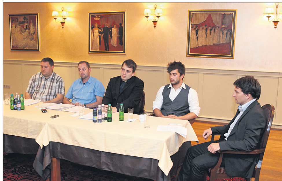
S poslanskega večera z naslovom Boj proti brezposelnosti med mladimi na Ptujem in Ormoškem