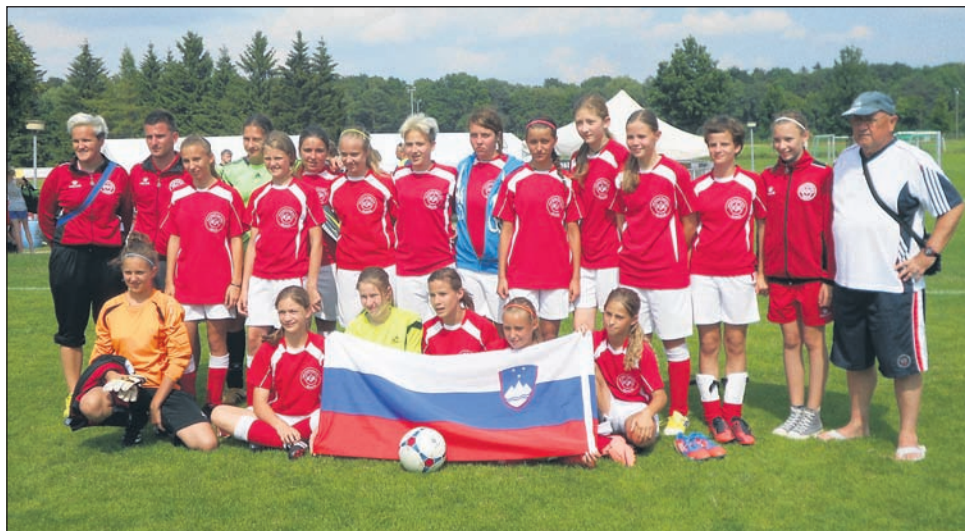
Ekipa ŽNK MSM Ptuj je v Nemčiji navdušila z odličnimi predstavami.