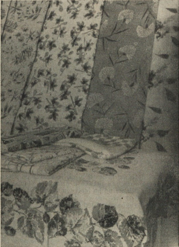
Naši novi tiskani vzorci

Posebno poglavje je bilo v preteklem letu preskrbovanje s konopljenim vlaknom, ki je domača surovina. Zaradi velikega izvoza konopljinega vlakna je nastalo veliko pomanjkanje na domačem tržišču. Na ta način nismo mogli nabaviti potrebnih količin, to je 640 ton, temveč samo 400 ton. Iz tega vzroka smo imeli velike zastoje v predilnici konoplje in nadalje v tkalnici gasilnih cevi.