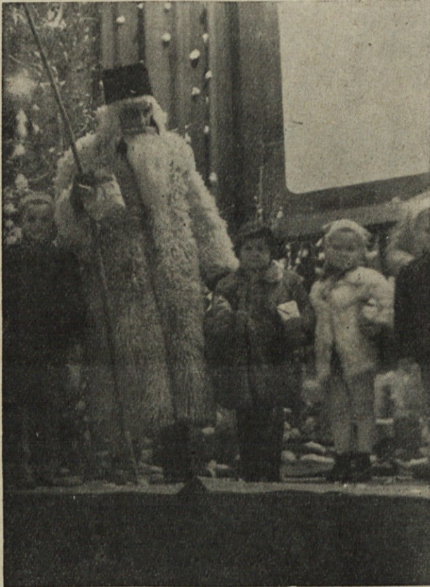
Dedek Mraz je obiskal najmlajše

Začnimo pri najmlajših. Otroci naših delavcev gledajo skozi vse leto, kako njihovi starši hodijo v tovarno na delo, na koncu leta so pa tudi oni prišli na vrsto. Dedek Mraz jih je poklical, toda ne na delo, ampak da jih obdaruje. Tako so 30. decembra popoldne napolnili kinodvorano otroci. Po predvajanju kratkih otroških filmov je Dedek Mraz obdaroval 685 otrok, 11 bodočih mater in 24 vajencev. Vsakdo je dobil po 4 m flanele in vrečico slaščic.