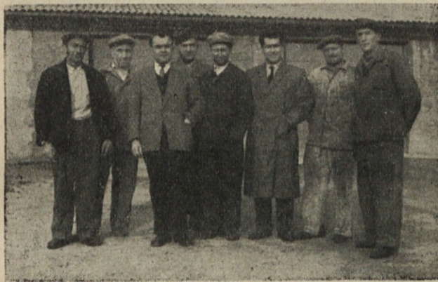
Člani upravnega odbora našega podjetja

Finančno poslovanje je teklo normalno in so bila kreditna sredstva zadovoljiva. Vrednost skupnih zalog je bila nekaj nižja od odobrenih kreditov. Razmerje terjatev in obveznosti je bilo aktivno za podjetje. Vse obveznosti iz proračuna so bile poravnane oziroma bodo za mesec december vplačane do konca januarja. Zaradi ugodnih tečajev na deviznem obračunskem mestu je podjetje nabavilo nekaj deviz za nakup barv in utenzilij iz uvoza.