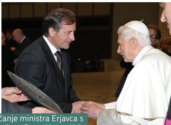
Srečanje ministra Erjavca s papežem Benediktom XVI.

Minister Erjavec je 13. in 14. novembra obiskal Sveti sedež in Suvereni malteški viteški red. V pogovorih je poudaril pomen vzdrževanja in krepitve rednega dialoga.