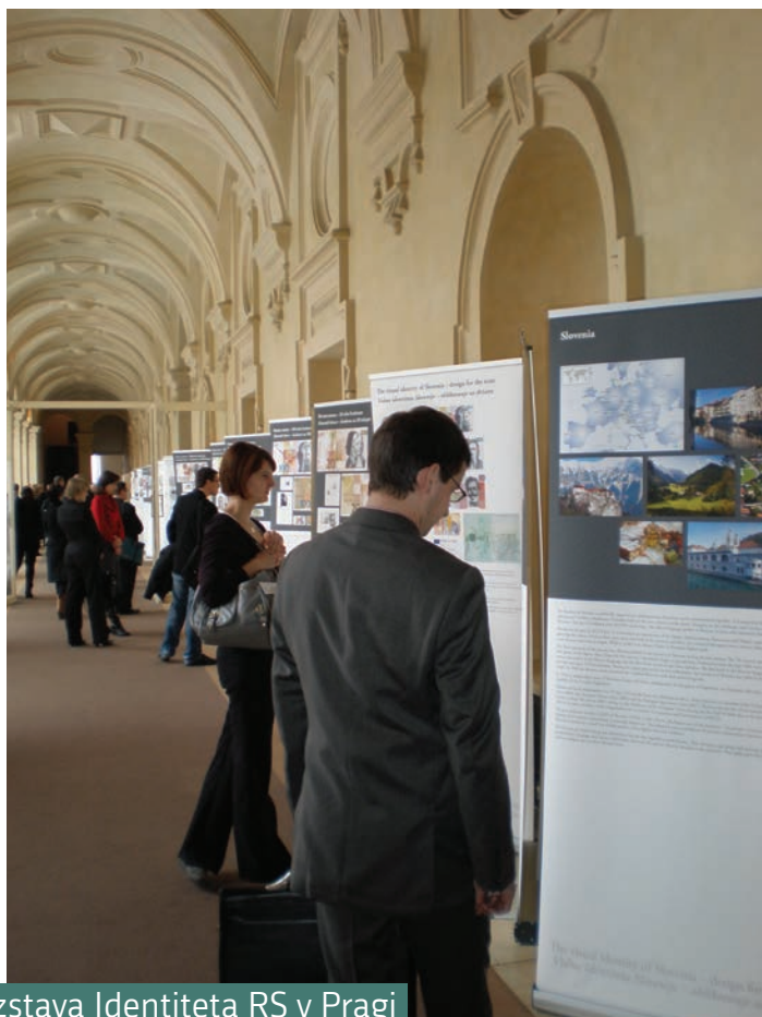
Potujoča razstava Identiteta RS v Pragi

Razstava Silent Revolutions: Contemporary Design in Slovenia je plod učinkovitega sodelovanja pristojnih vladnih ustanov in gospodarstva. V okviru te pobude je Ministrstvo za izobraževanje, znanost, kulturo in šport leta 2011 prevzelo nosilno