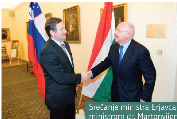
Srečanje ministra Erjavca z madžarskim zunanjim ministrom dr. Martonyijem

ter izboljšanju infrastrukturnih povezav v prometu in energetiki. Sklenjeni so bili dvostranski dogovori o sodelovanju na področju znanosti, tehnologije in inovacij. Državi sta okrepili izmenjavo pogledov na sodelovanje med državami srednje Evrope ter dogajanja v širši regiji, s posebnim poudarkom na Zahodnem Balkanu.