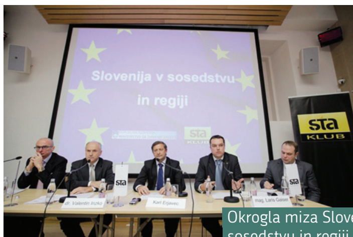
Okrogla miza Slovenija v sosedstvu in regiji

Ministrstvo je skupaj s Slovensko tiskovno agencijo kot medijskim partnerjem priredilo štiri okrogle mize o zunanjepolitičnih vsebinah z namenom ozaveščanja javnosti o dejavnostih in vlogi Slovenije na zunanjepolitičnem področju: Slovenski razvojni dnevi: Leto 2015 in pogled naprej, Diplomacija in gospodarstvo – z roko v roki do novih priložnosti, Več Evrope – več Slovenije, Slovenija v sosedstvu in regiji. V razpravi so sodelovali minister za zunanje zadeve Karl Erjavec, predstavniki slovenske diplomacije ter ugledni strokovnjaki in poznavalci obravnavanih področij.