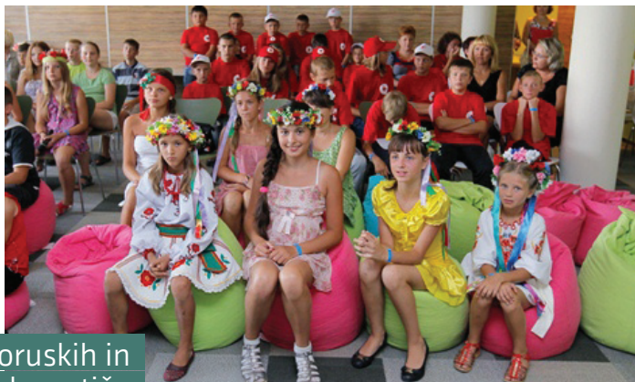
Program rehabilitacije beloruskih in ukrajinskih otrok na Debelem rtiču

Z Moldavijo se je nadaljeval razvojni projekt Slovenske filantropije Izboljšanje izobraževanja in socialne integracije romskih otrok v Moldaviji. Slovenija se je vključila tudi v delo Delovne skupine za Moldavijo v okviru Skupnosti demokracij.