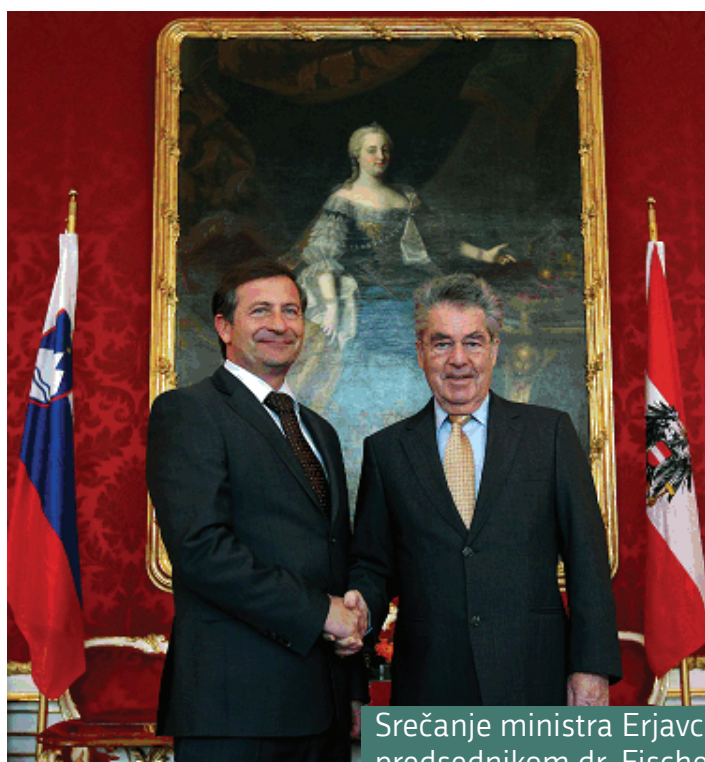
Srečanje ministra Erjavca z avstrijskim zveznim predsednikom dr. Fischerjem

Minister Karl Erjavec se je 20. marca mudil na nastopnem obisku v Avstriji. V maju sta slovenski in avstrijski zunanji minister skupaj obiskala Bosno in Hercegovino, srečala pa sta se tudi oktobra v Mariboru ob predstavitvi avstrijske kulturne ambasade v evropski prestolnici kulture.