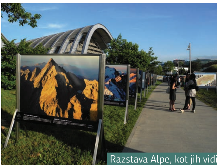
Razstava Alpe, kot jih vidijo Ptice