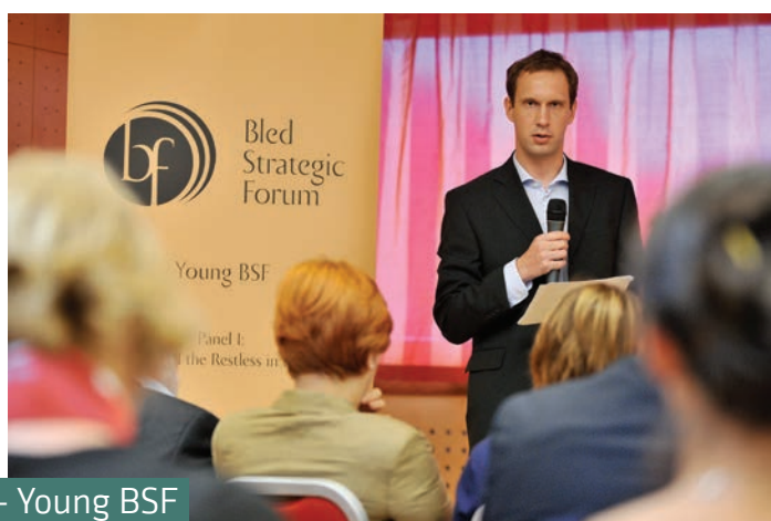
Strateški forum Bled – Young BSF

Novost minulega leta, Business BSF, je bil organiziran v sodelovanju z IEDC – Poslovno šolo Bled. S številnimi uglednimi gosti, med katerimi velja omeniti osrednjega govornika, generalnega sekretarja OECD Angela Gurrío, je bil poslovni forum odlična priložnost za navezavo stikov med slovenskimi in tujimi gospodarstveniki ter za iskanje čim uspešnejših rešitev za ponovni zagon gospodarstva in stabilizacijo finančnega sistema.