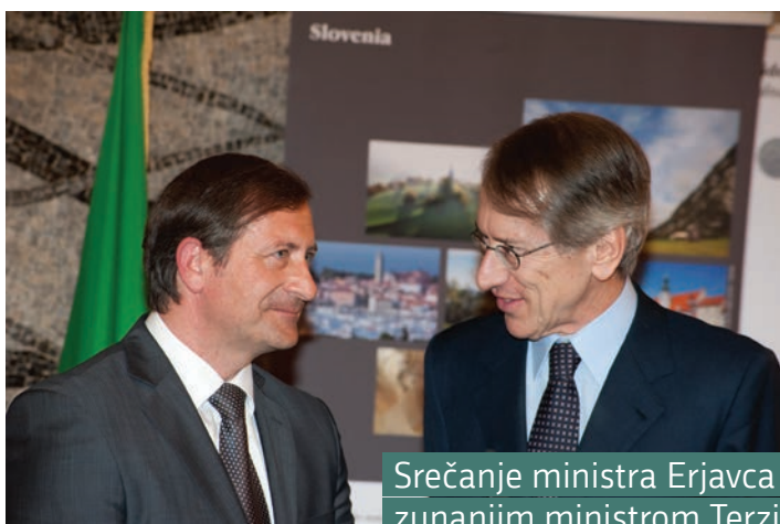
Srečanje ministra Erjavca z italijanskim zunanjim ministrom Terzijem

Nastopni obisk ministra Karla Erjavca v Italiji je bil 27. marca. Ministra Erjavec in Terzi sta se ločeno srečala tudi ob državniškem obisku predsednika Italije Napolitana julija v Sloveniji; oktobra pa sta na Brdu pri Kranju vodila 4. zasedanje Koordinacijskega odbora ministrov med Slovenijo in Italijo. Zasedanja so se udeležili tudi ministri, pristojni za gospodarstvo, energetiko, okolje, infrastrukturo, promet, kmetijstvo, univerze in znanstveno raziskovanje. Predsednik Vlade Republike Slovenije se je junija mudil v Rimu.