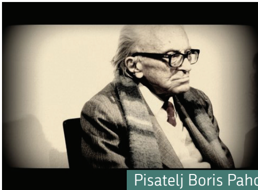
Pisatelj Boris Pahor

Ministrstvo je skupaj z veleposlaništvu v Bukarešti, Parizu in Pragi soorganiziralo odmevne nastope pisatelja Borisa Pahorja. V Bukarešti so 15. novembra v veliki konferenčni dvorani Narodne knjižnice Romunije priredili pogovor nestorjev slovenske in romunske umetnosti, Borisa Pahorja in romunskega zgodovinarja Neaguja Djuvare, z naslovom Skozi pogled stoletnikov: identiteta, svoboda in demokracija. Pahor je 30. novembra v Parizu na povabilo inštituta Memoires de l'edition, ki ga vodi nekdanji francoski kulturni minister Jack Lang, skupaj s Stéphanom Hesselom sodeloval na srečanju z naslovom Stoletje dialoga. V Pragi pa je 13. decembra nastopil kar dvakrat, dopoldne na Filozofski fakulteti Karlove univerze in zvečer na predstavitvi v galeriji Montmartre, ki je bila organizirana v sodelovanju s knjižnico Vaclava Havla.