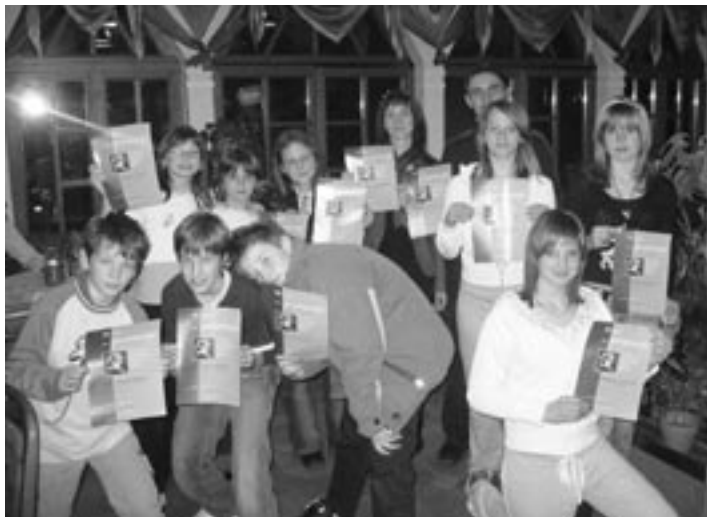
Občan - 23. maj 2007