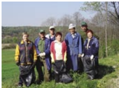
V Jiršovcih in Vintarovcih so združili moči