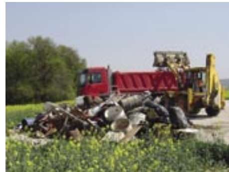
Odpadke so še isti dan odpeljali na Čisto mesto