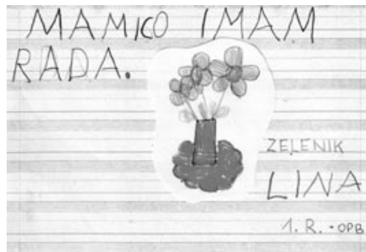
Občan - 23. maj 2007

5. Zavzemajmo se za izrabo alternativnih virov energije (sonce, geotermija, biomasa ...), saj ti ne povzročajo dodatnih izpustov CO 2 v ozračje.