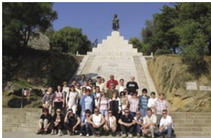
Pod Napoleonovim spomenikom