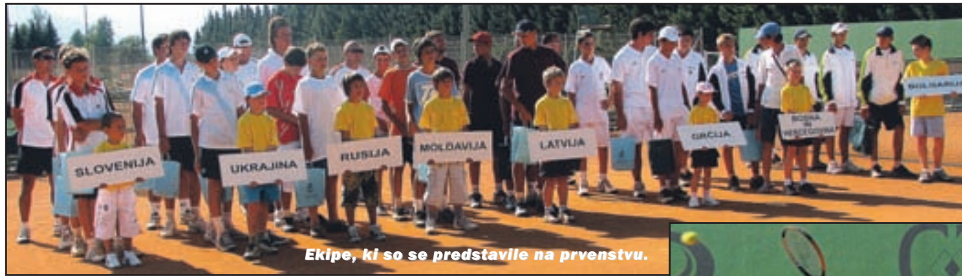
Ekipe, ki so se predstavile na prvenstvu.

Evropsko prvenstvo za dečke do 14 let - Hkrati potekal tudi turnir rekreativcev - Sodelovalo devet evropskih držav