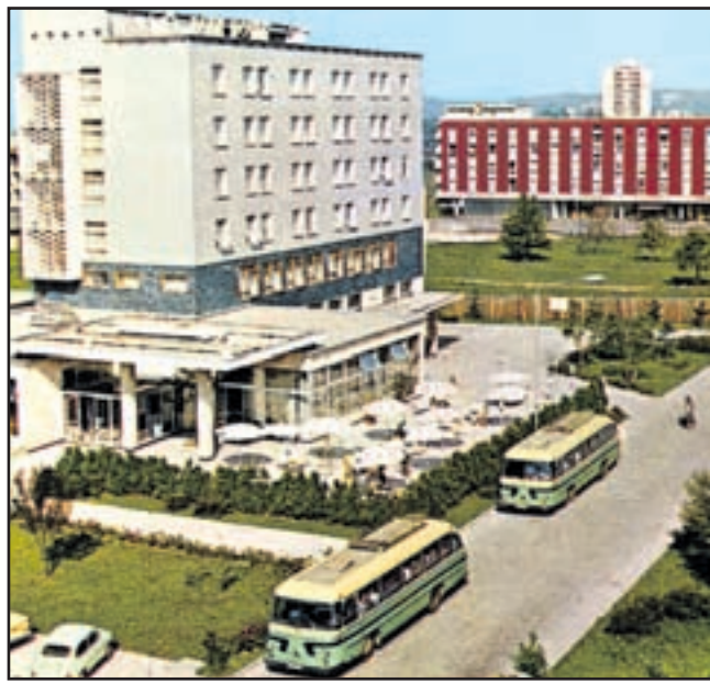
Hotel Paka v Velenju