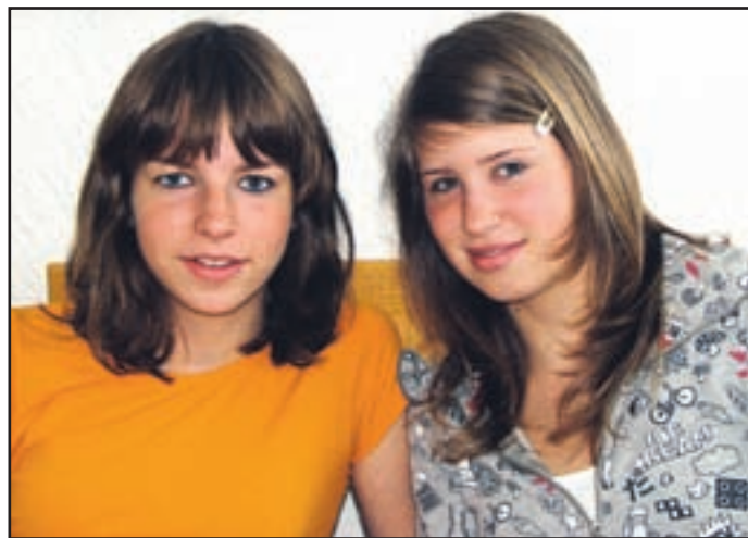
Manca in Tjaša: "Za uporabo so najprimernejše vrečke iz blaga, ker se najhitreje razgradijo in ker tudi po večkratni uporabi ostanejo enake."

ra od teh drži in katera ne, sta preverjali tako, da sta na omenjenih površinah zakopali pet različnih vrečk: papirnato, biorazgradljivo, vrečko iz blaga, navadno plastično ter vrečko za sadje in zelenjavo. Vrečke sta trikrat odkopali, in sicer po 8, 13 in 23 tednih. "Pridobili