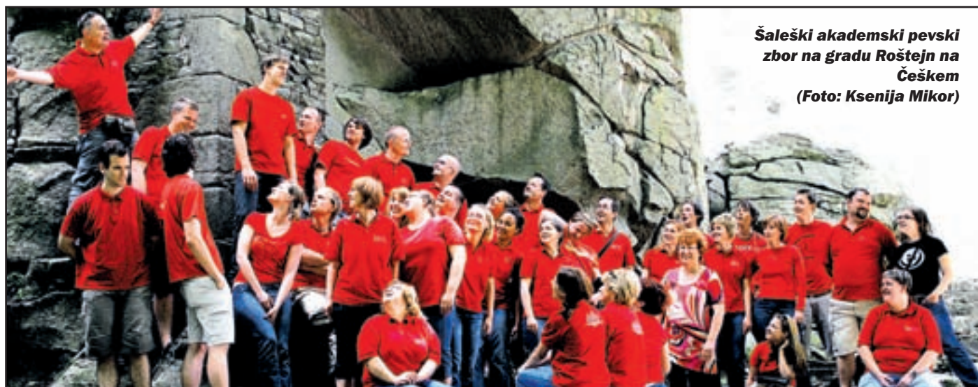
Šaleški akademski pevski zbor na gradu Roštejn na Češkem

Od petka, 27., do nedelje, 29. junija je na Češkem gostoval Šaleški akademski pevski zbor Velenje pod vodstvom Danice Pirečnik