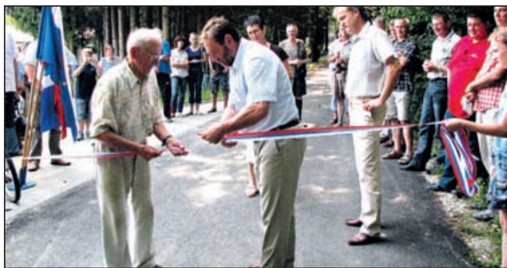
Skupaj so se veselili nove ceste.