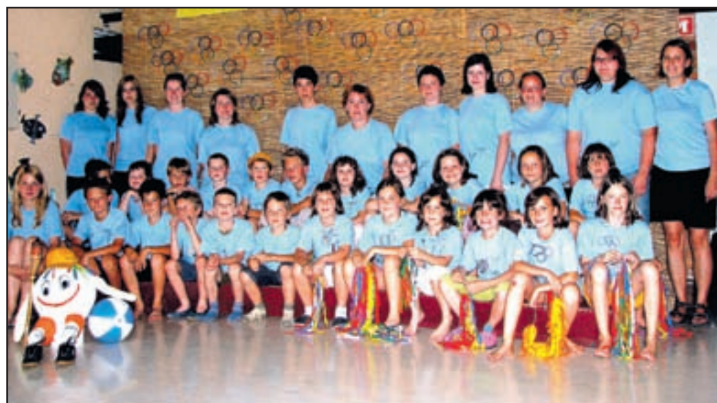
Udeleženci tabora z animatorkami tik pred zaključno prireditvijo, na katero so povabili tudi starše.

Z drugimi kadri se dogovarjajo. "Imamo ustrezno habilitirane predavatelje, nekaj docentov, rednih in izrednih profesorjev, tako da bo zasedba profesorskega kadra dobra. Seveda želimo, da študentom ponudimo čim boljši kader, zato da bo njihovo znanje po končanju študija takšno, da bodo zanimivi za zaposlitev."