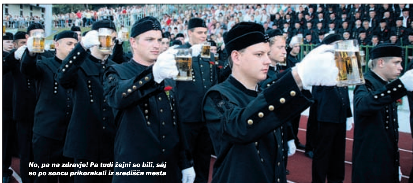
No, pa na zdravje! Pa tudi žejni so bili, saj so po soncu prikorakali iz središča mesta

novi 600 MW blok v Šoštanj, ki bo v svoji življenjski dobi porabil ves razpoložljivi lignit v dolini, je pravi odgovor na zahteve energetskega-klimatskega svežnja, ki jih pred Slovenijo postavlja EU," je poudaril, a povedal - in to naravnost, kot je pri knapih v navadi, tudi tisto, kar vsem ni in jim ne bo všeč. "Nizka cena električne energije za gospodinjstva izčrpa slovenske proizvajalce, močno ovira konkurenčno poslovanje