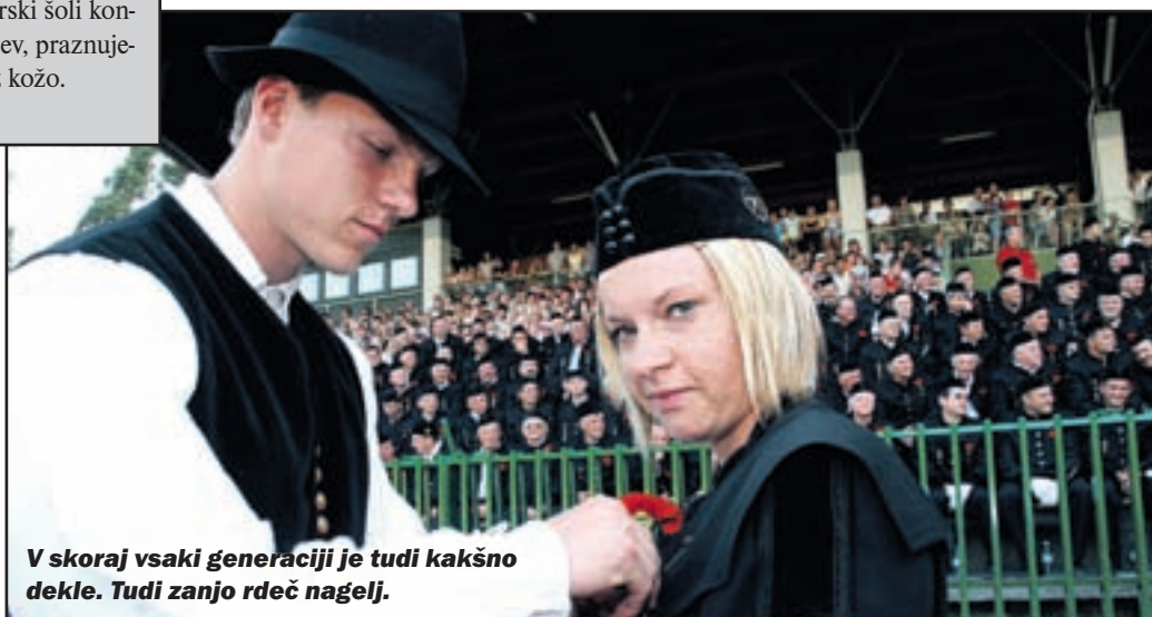
V skoraj vsaki generaciji je tudi kakšno deklet. Tudi zanjo rdeč nagelj.