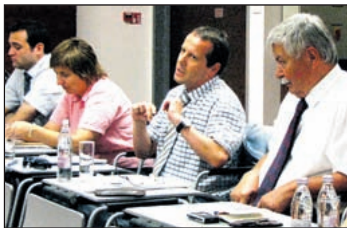
Podobni posveti so bili organizirani že v polovici slovenskih občin.

Velenje, 24. junija - V dvorani Nove je v torek dopoldne potekal regijski posvet z župani, direktorji občinskih uprav oziroma s pristojnimi s področja financ občin Savinjsko-šaleške regije na temo problematike razpolaganja z javnimi financami v lokalnih skupno-