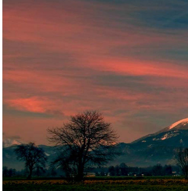
Na vrhu Mrzle gore

V času določanja trase Kamniško-Savinjskih Alp sem imel dilemo, ali po Ficku vključiti k prečenju Kamniško-Savinjskih Alp še skupine Velike planine, Mrzle gore in Krofičko. Zaključil sem, da bi mi Velika planina in Krofička tako rekoč pokvarile "smiselnost" tako zastavljene poti, saj bi se moral vrniti po isti poti, kar mi ni najbolj dišalo. Zato sem Veliko planino in Krofičko izpustil in k prečenju raje dodal meni ljubše planine (npr. planino Polšak), vrhove (npr. Križevnik) in planinske poti (npr. po Kocbekovem grebenu na Malo Ojstrico). Več o tem, zakaj nisem dodal skupino Mrzle gore, sem zapisal v Planinskem vestniku iz leta 2017 (številka 4), kjer sem opisal prečenje slovenskih Karavank. 8