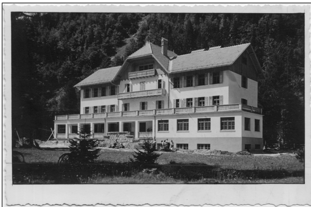
Razglednica Gozd Martuljka – nekdanji "Mladinski dom železničarjev" iz tridesetih let 20. stoletja – nahajal se je v bližini današnjega hotela "Špik" (NUK, Zbirka razglednic – Gozd Martuljek, Inv. št. 1989/825-3).

čista voda je postala nepitna že na samem izviru visoko v hribih (Jureževo zajetje).