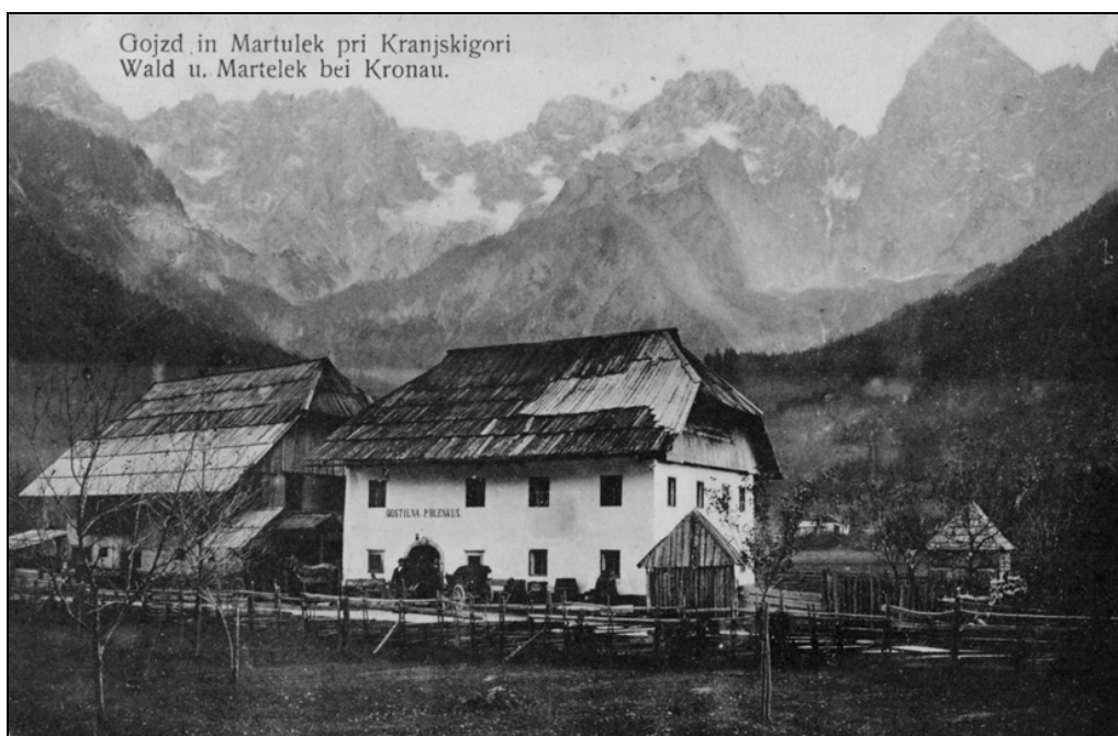
Razglednica Gozd Martuljka, ki prikazuje eno prvih vaških gostiln "Pri Blenkus" – iz začetka 20. stoletja (NUK, Zbirka razglednic – Gozd Martuljek, Inv. št. 1990/2263-3).