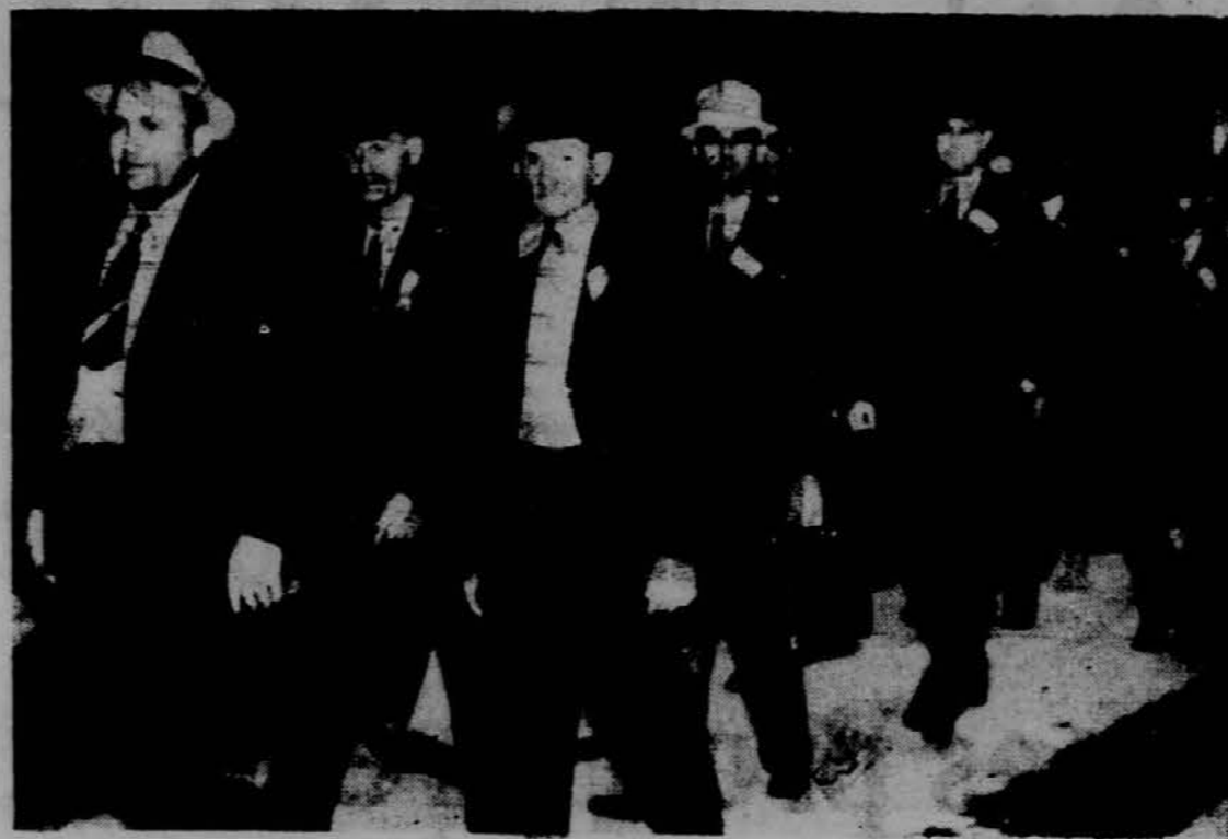
Na sliki vidimo porotnike, ki so bili izbrani za sodnijsko razpravo proti 65 osebam, uradni kom promogovnih družb ter proti bivšemu šerifu in njegovim pomagačem, katere je zvezna vlada obtožila, da so preprečevali rudarjem v Harlan okraju, da se ne organizirajo v delavskih unijah.