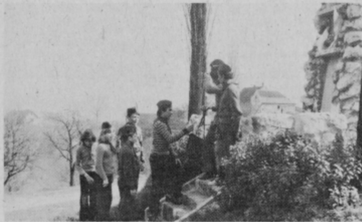
Primopredaja kurirčkove pošte pri spomeniku v Ilovcih.

mimo straž, saj nihče ni slutil, da opravljajo tako pomembno delo za narodnoosvobodilno vojsko. Prinesli veselo sporočilo o pomoči, ali