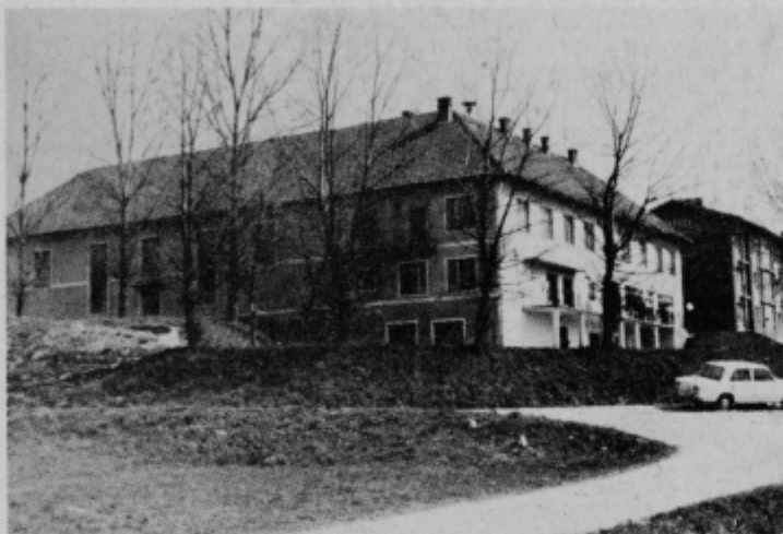
Zadružni dom pri Miklavžu, v katerem je dvorana potrebna temeljite obnove

naj v naslednjih petih letih zbrali približno 300.000,00 din. Predvidevajo, da se bo iz drugih virov steklo še dodatnih 225.000,00 din in bo krajevna skupnost tako razpolagala v tem obdobju z 525.000,00 din,