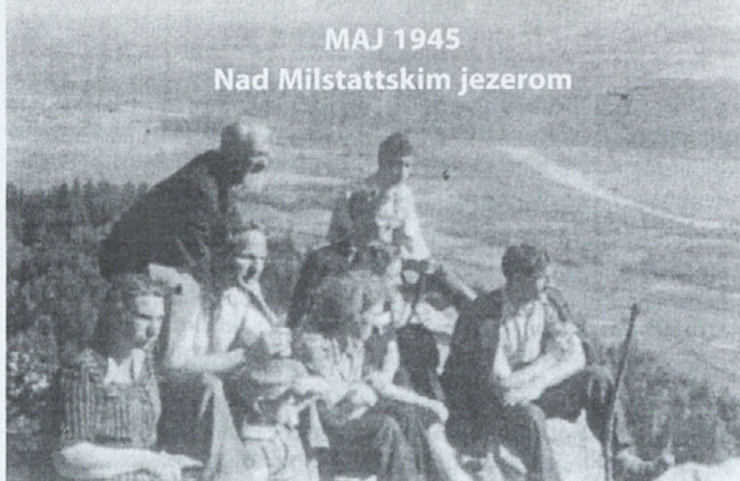
General Rupnik poslednjič z družino in prijatelji.

Tudi civilisti, ki so šli z nami, so v baraki. Na enem koncu so moški, na drugem žene, sedaj brez otrok, in dekleta.