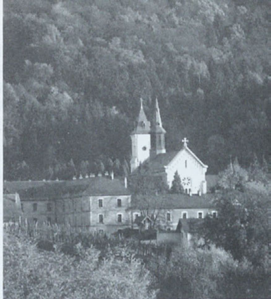
Kartuzija Pleterje ob vznožju Gorjancev