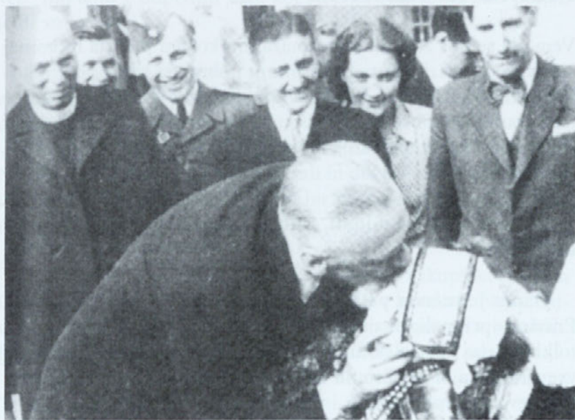
Da bi mladi rod živel v blagostanju, to je bila vedno želja generala Leona Rupnika.

Skozi tri dni je bilo slišati iz globine obupne klice na pomoč in partizanski stražar zaključuje: »Še nobena reč na svetu se mi ni nikoli tako smilila kot ta uboga dekleta.«