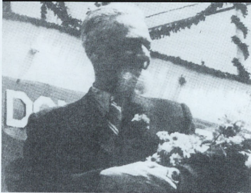
Gen. Leon Rupnik je pozdravljen s cvetjem in slavolokom.