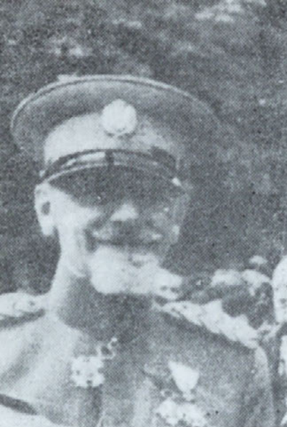
General Leon Rupnik, Šumadijska divizija

Je pa res, da partizani niso prav nič popustili v svoji brutalnosti. No ja, prizadejali smo jim marsikatero grenko in jih lovili kot zajce. Toda, kaj imajo pri tem ženske in otroci?