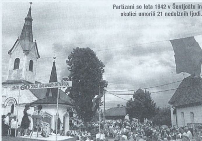
Partizani so leta 1942 v Šentjoštu in okolici umorili 21 nedolžnih ljudi.

Komunisti so junija leta 1942 v Šentjošt pripeljali veliko propagandnega materiala, živil, obleke, čevljev.