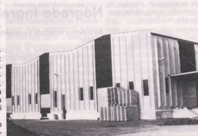
Skladiščna hala Juteks – Loznica. Gradi PO GO Žalec