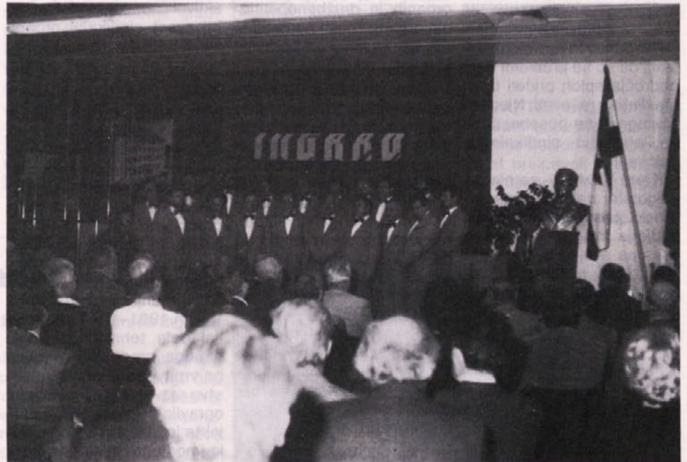
Program je popestril Komorni moški zbor Celje